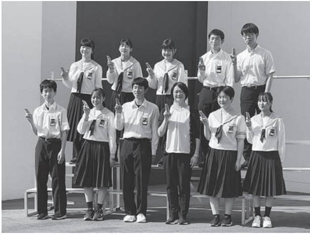
鹿部中学校吹奏楽部の皆さん

出場した生徒たちは、日ごろの練習の成果をいかんなく発揮し、素敵な演奏を披露しましたが、惜しくも銀賞となりました。