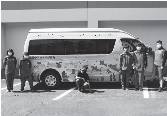
鹿部中学校美術部の皆さん

5月から大岩地区、鹿部の一部地域、出来瀨地区、リゾート地区を対象に運行しているデマンドバスについて、利用者の皆様に親しみを感じていただけるよう、ワゴン車にラッピングを施しました。 ラッピングのデザインは、鹿部中学校美術部の皆さんに協力いただき、鹿部町の自然や特産品をイメージしたイラストとなっています。 デザイン作成にご協力いただきました美術部の皆さんありがとうございます。