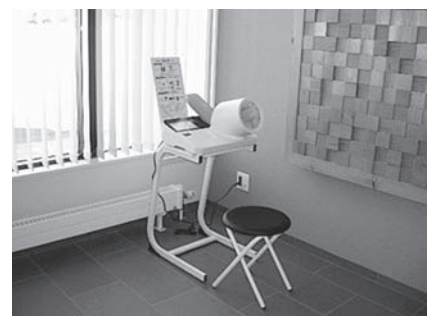
鹿部町役場1階の多目的スペースに設置しています

血圧値などで心配なことがある場合は、かかりつけ医か保健師までご相談ください。自動血圧計は、どなたでも使うことができますので、皆さんの健康管理にお役立てください。