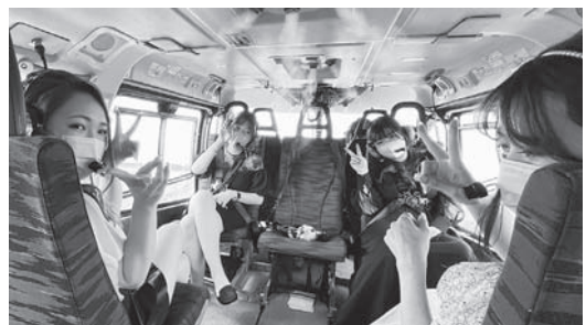
協力：セントラルヘリコプターサービス株式会社