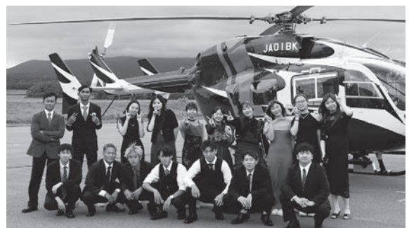
協力：セントラルヘリコプターサービス株式会社