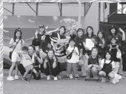
女子優勝 「みそじーず」