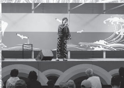
シーサイドステージinしかべ