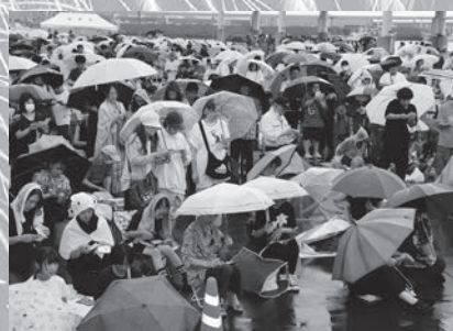
温泉ビンビンビンゴ