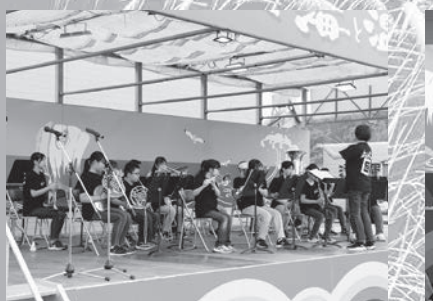
鹿部中学校吹奏楽部