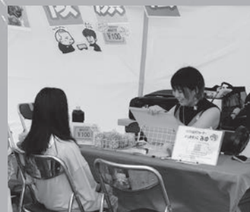
似顔絵ペンダント