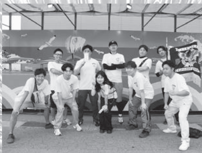
男子優勝 「タートルズ」