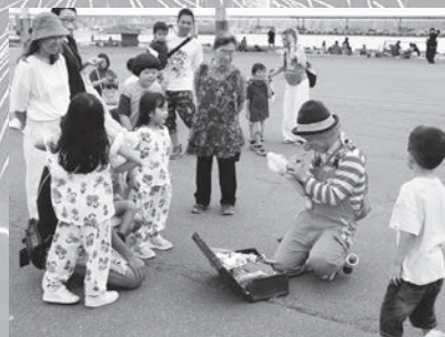
ピエロの場内パフォーマンス