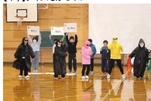
【6年】器楽演奏&合唱「旅立ちの日に」