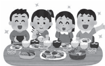
家族みんなで早寝早起き朝ごはん