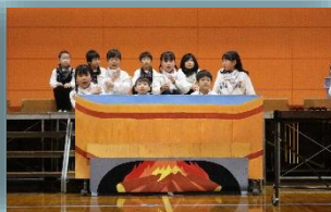
「てんぷく丸 東へ」(6年)