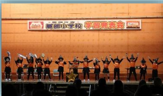
「リズム表現 ひょうげん」(5年)