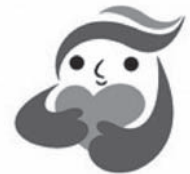
犯罪被害者等支援シンボルマーク ギョットちゃん