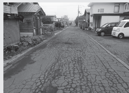
町道鹿部南2号線 道路整備前

町道鹿部南2号線の改良舗装工事のほか、町道舗装補修工事、町道区画線整備工事、道路附属物修繕工事などの維持補修工事を実施しました。