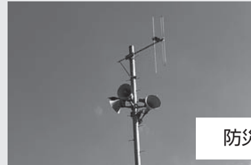
防災行政無線屋外拡声器