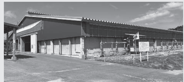
漁業系廃棄物リサイクル施設

当施設は、漁業活動等の円滑化や業者負担軽減を図るため、平成14年度から供用を開始しており、施設の維持管理を徹底し、施設が稼働し続けるよう必要修繕を計画的に進め、適正な廃棄物処理施設の運営に努めています。