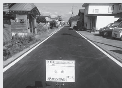
町道鹿部南2号線 道路整備後