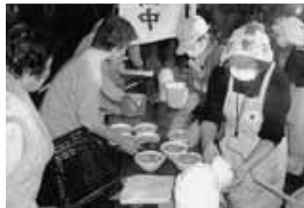
新潟中越地震での道内赤十字奉仕団の炊き出し活動

平成19年度で集まった社費は、 鹿部町で総額630,300円でした。 たくさんの善意をありがとうございました。