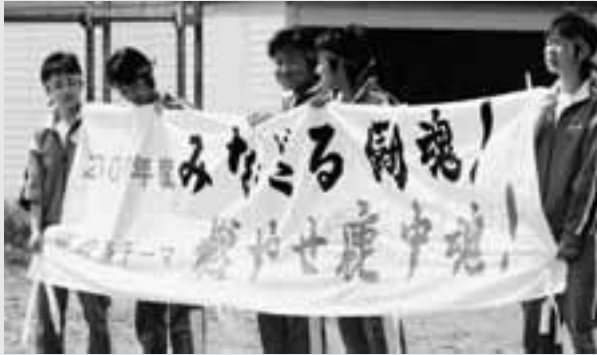
今年も、鹿中の魂が伝わる、熱い展開でした！