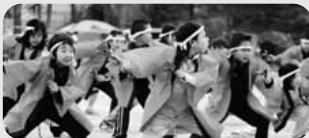
3・4年生は「キッズソーラン」♪