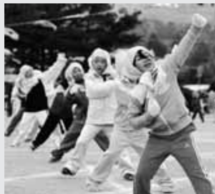
1・2年生は、忍者に変身!?