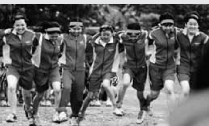
7人8脚は、チームワークが命！