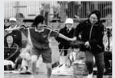
今年は父母もリレー！