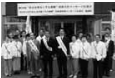
保護司会をはじめとする参席者の皆さん

この運動は、決して難しいものではありません。皆さんは、「相手の気持ちを理解すること」や「子どもをぎゅっと抱きしめること」、「どんだんあいさつすること」など、明るい社会づくりのために、身近なところから協力してみてください。