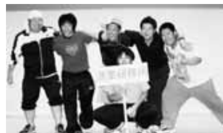
激戦の末、一般の部を制した「漁業研修所チーム」