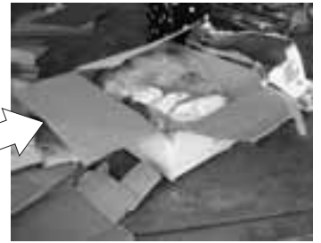
ナイロン等の袋が混入！