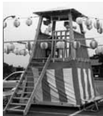
新しくなった盆踊りのやぐら