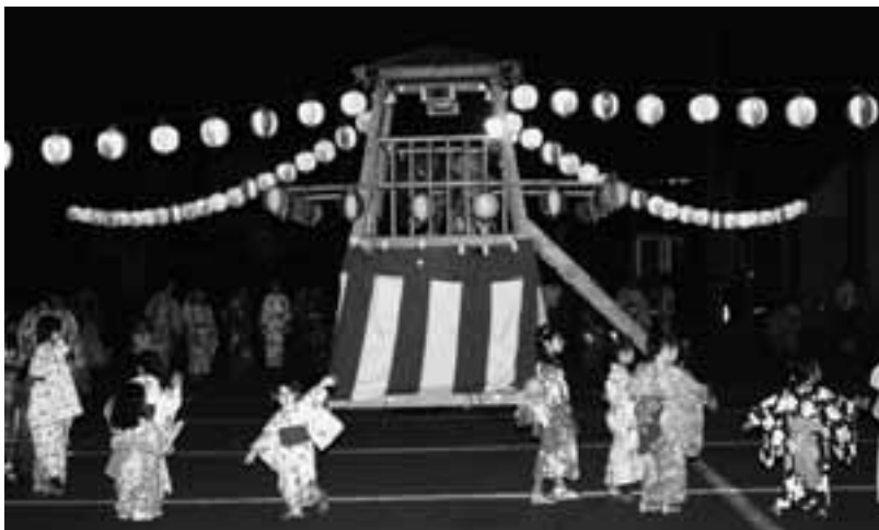
華やかになった盆踊り大会

今回の整備によって、役場庁舎前で行われた盆踊り大会には新しいやぐら、ちょうちん、太鼓、音響機器類がお披露目され、多数の参加者により例年以上に盛り上がった大会となりました。