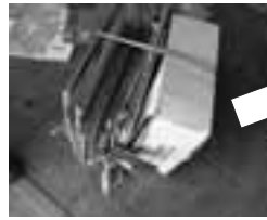
怪しい箱の中には…