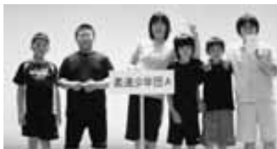
ジュニアの部を制した「柔道スポーツ少年団A」チーム

6月26日、総合体育館において第9回町民玉入れ大会が開催され、幼児から大人までの全32チーム250名が熱戦を繰り広げました。玉入れは、1チーム6名の選手が50個の玉を籠に入れるまでの時間を競うタイムトライアルで、最後のアンカーボールが入らず周囲からは盛んに声援が送られていました。