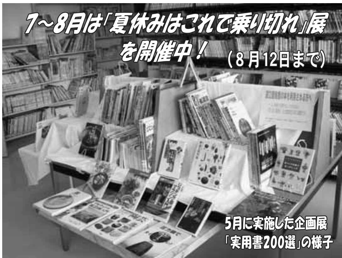
5月に実施した企画展 「実用書200選」の様子

今、図書室では企画展「夏休みはこれで乗り切れ！」展（8月12日まで）を行い、道立図書館からの支援を受けた本を中心に 読書感想文に適した本、工作、自由研究の参考になる本 などを多く集め、展示しています。道立図書館からの本は、 一人何冊でも貸すことができます ので、多くの方のご利用をお待ちしています。