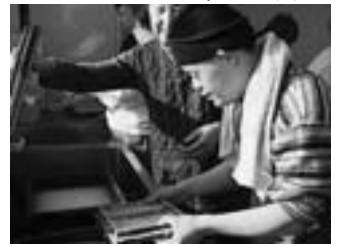
牛乳パックを使ったはがき作り

ノルディックウォーキングをしました。 ダイエットには運動も大切です。そこで、鹿部公園でノルディックウォーキングをしました。2本の専用のポールをそれぞれ左右の手に持ち、それを地面に突きながら歩きます。エネルギーの消費量は普通のウォーキングよりも20%多いそうです。用具（ポール）は総合体育館で無料で貸してくれます。 ぜひ、一度、お試しを！