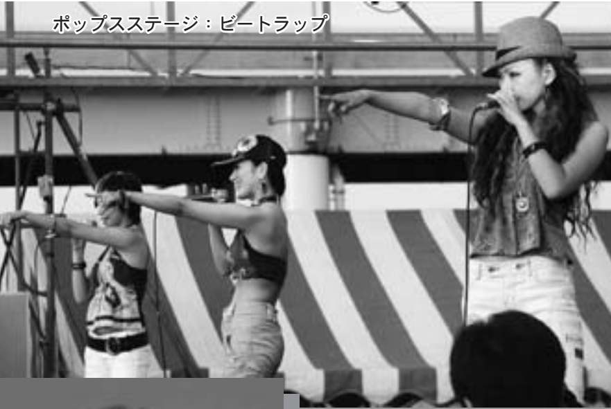
ポップステージ：ビートラップ