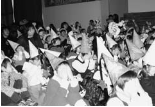
サンタさん来てくれるかな？ 「どきどき」「わくわく」！