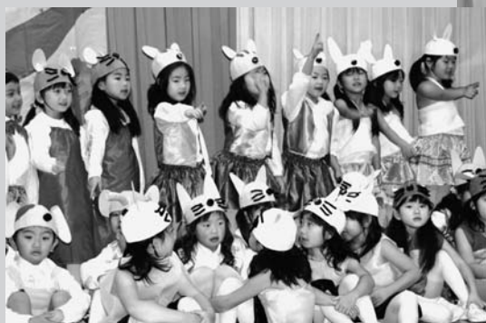
うさぎ組さんの劇「ねずみくんとシーソー」 最後はみんなお友達!めでたし、めでたし☆