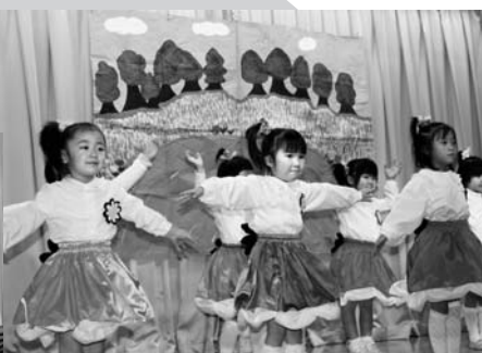
さくら組さん、かわいい〜!