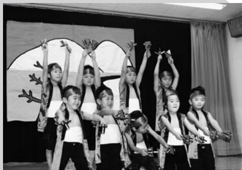
うさぎ組さん、かっこいい!