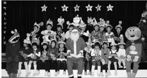
最後にサンタさんと記念写真！ ハイ☆チーズ！