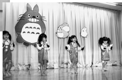
もも組さんは かわいい妖精さんに☆大変身☆