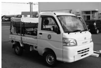
融雪剤散布機搭載軽トラック

冬道は夏の道路に比べ停止時の制動距離が長くなるなど、事故の危険性が高くなりますので、安全運転に心がけ、事故に遭わないようにしましょう。