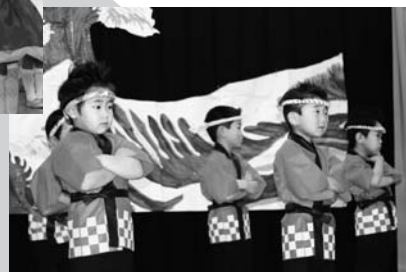
たんぼほ組さん、鹿部の大漁を ねがって!?「大漁まつり」♪