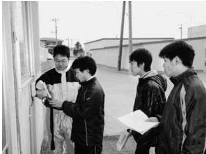
水道メーター検針を体験

各職場での労働を体験した生徒達は、初めてのことで戸惑う場面もありましたが、一生懸命に働く喜びも体験できたと思います。 今年度、職場体験学習にご協力いただいた事業所等は次のとおりです。大変ありがとうございました。