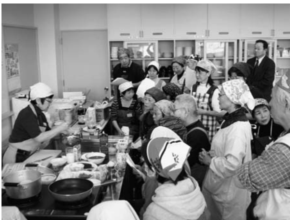
先生の分かりやすいデモンストレーションの様子

この講習会で学んできた知識を町民の皆様の健康づくりのために、ぜひ役立てていただきたいと思ひます。