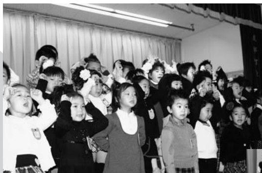
年中さんによる「いぬのおまわりさん」 みんな元気に、わんわんわわ〜ん♪