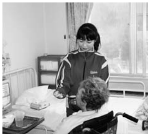
渡島リハビリテーションセンターでは、入所者の食事のお手伝いを体験

12月3日(木)に鹿部中学校1年生43名が、町内13の事業所等において職場体験学習を行いました。 職場体験学習は、平成18年度から中学校1年生を対象に、町独自で実施している事業で、近年、二トやフリーターの増加という問題がある中、若いうちに正しい職場観を持ち、働くことに対する興味・関心、進路選択への意識や働くことの意義、喜び、働く人々への感謝の心、物を大切にすること、礼儀作法や言葉遣いなど、体験学習を通じて学ぶことができるよう実施されております。