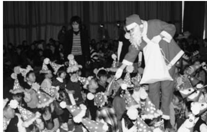
やった〜っ！きた〜っ☆サンタさんだ〜！