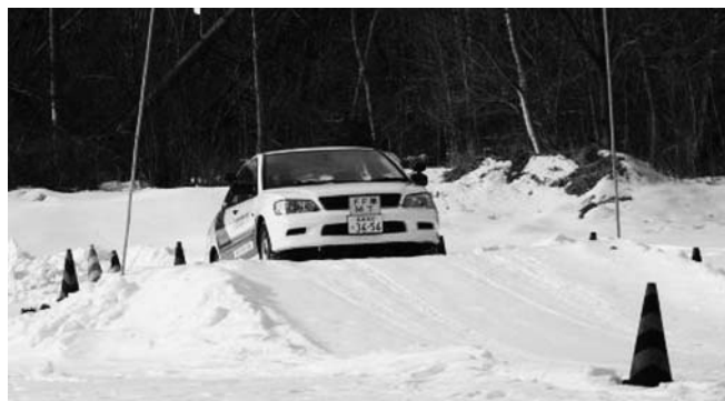
坂道発進での講習