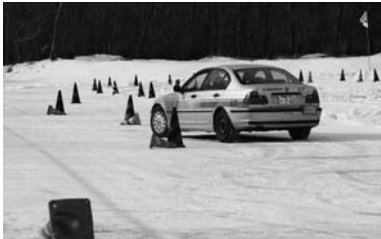
スラロームでの講習

当日は冬道をより体験できるように事前に水撒きを実施し、ツルツル路面の状態講習が行なわれ、参加者の皆さんは普段よりスリッパしやすい状態での冬道運転を体験されました。