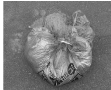
リレーポート茅部から返却された魚網が 入っている「燃やせるゴミ」の袋