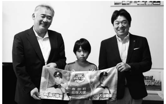
贈呈の様子：小学校