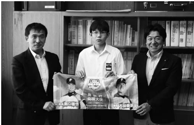
贈呈の様子：中学校