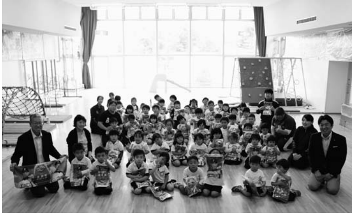
贈呈の様子：幼稚園

鹿部町が2019年の北海道17市町村応援大使に選定されていることを記念し、町から幼稚園、小・中学校のお子さんへ「応援大使タオル」を贈呈しました。