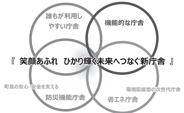
図1：基本理念・基本方針のイメージ図