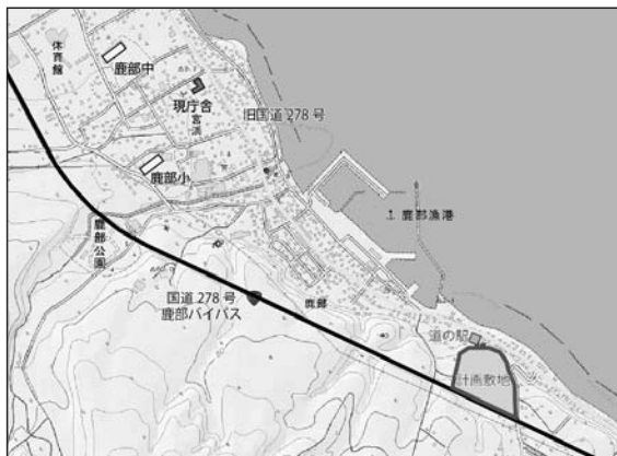
図2：計画敷地位置図

新庁舎の面積は、国の庁舎面積算定基準の規模算定や、職員数などを考慮して、概ね2,600㎡程度としました。