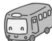
実証運行利用実績（6月分）（単位：人）

また、実証運行の終了に伴い、当分の間「コミュニティバス」を実施しますのでご利用ください。