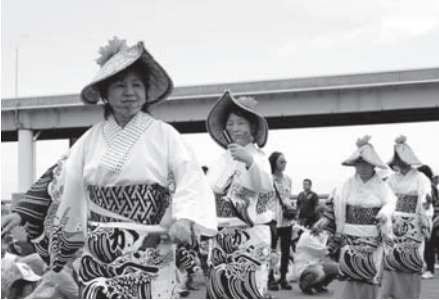
海と温泉のまつり音頭