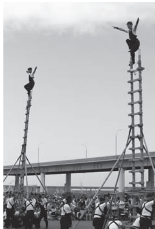
はしご乗り演技披露