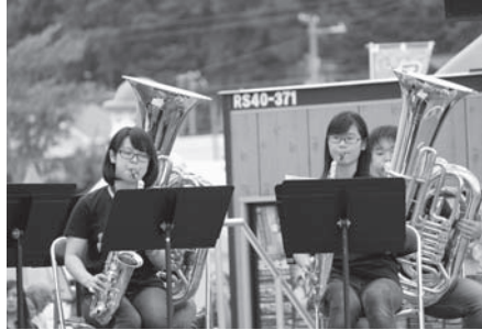
鹿部中学校吹奏楽部演奏