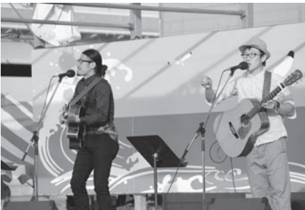
「くろまる」スペシャルライブ