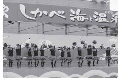
チアリーディングサークルAnge