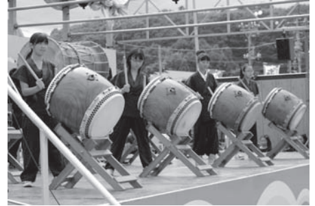
鹿部太鼓・ジュニア太鼓披露