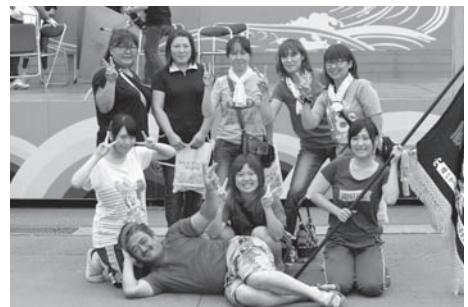
女子の部優勝 マザーシップ