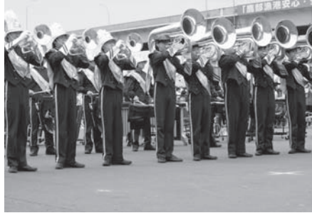
函館大学附属有斗高等学校マーチングバンド部演奏