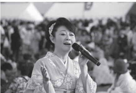
「ちはらさき」歌謡ショー