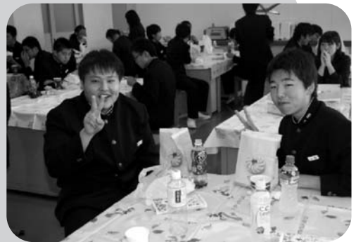
いろいろな食品が販売され、美味しくいただきました