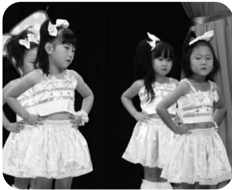
さくら組さんの「エウレカベイビー」。