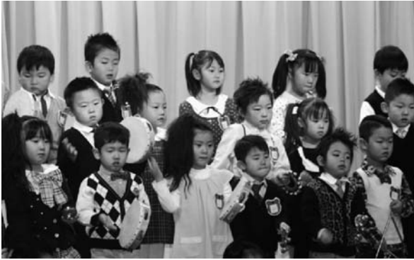
さくら組さんの「ミッキーマウスマーチ」♪