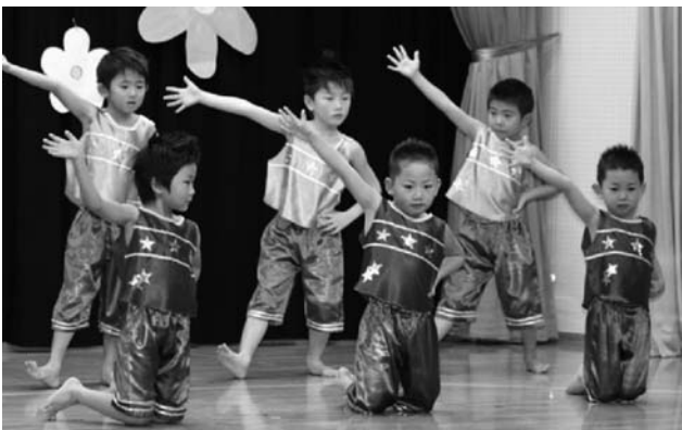
うさぎ組さんの「フラワー」。ポーズもバッチリ☆