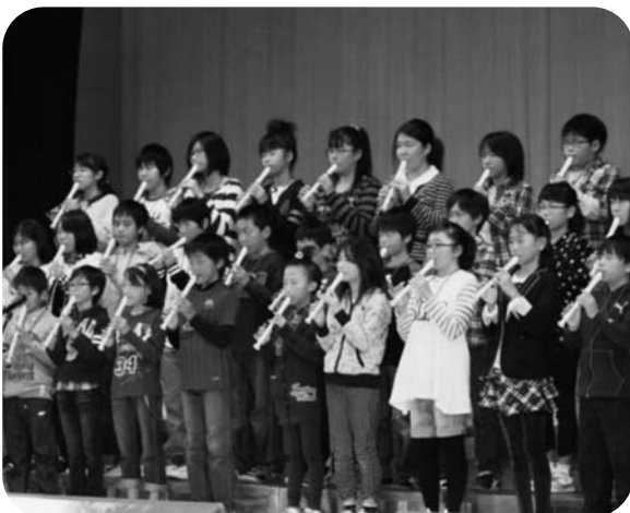
5年生のリコーダー合奏「星笛」