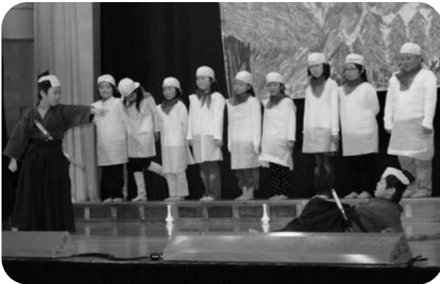
2年生の劇「おばけじぞう」