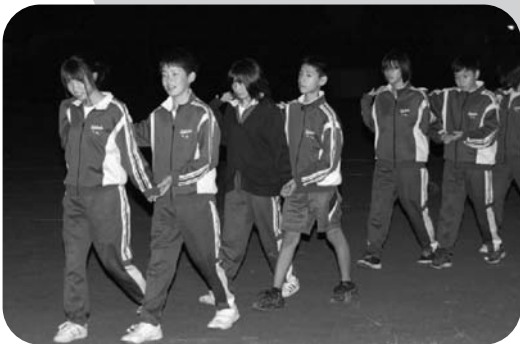
男女仲良くフォークダンス♪