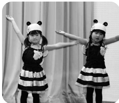
みかん組さん。かわいいミツバチに変身♪