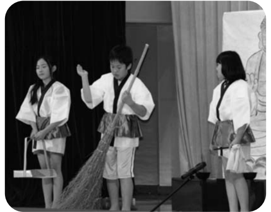
4年生の劇「四枚のおふだ」