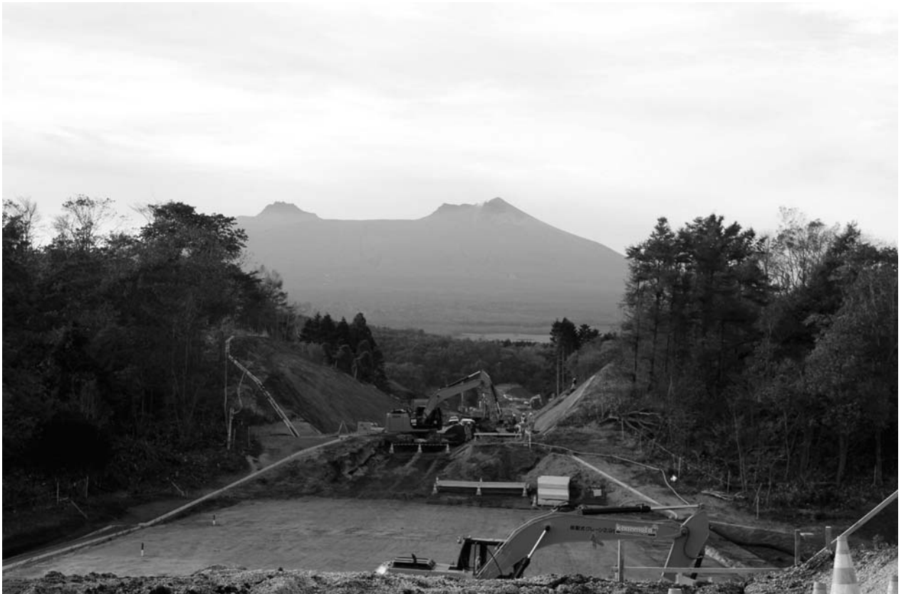
商工会裏山の工事現場：正面に秀麗駒ヶ岳が大きく視界に入ってきます。