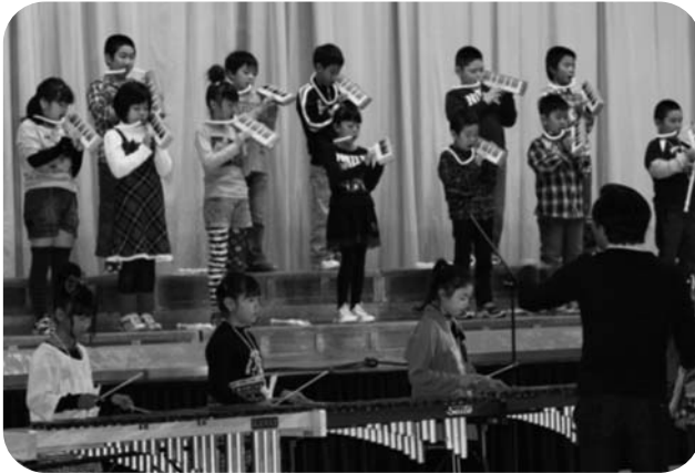
3年生の合奏「ハイ・ホー」