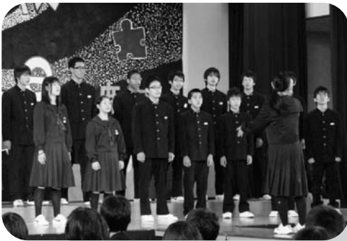
恒例の合唱コンクール