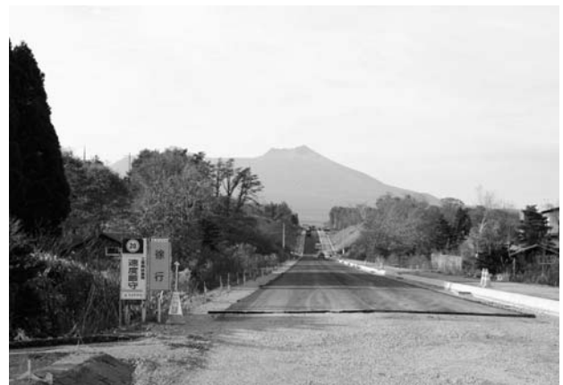
渡島リハビリ付近の交差点から本別方面