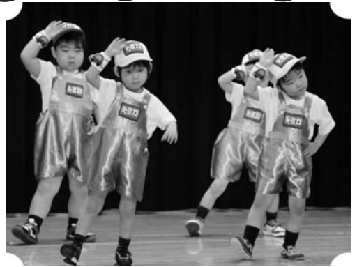
もも組さん。好きな乗り物に乗ってGo！