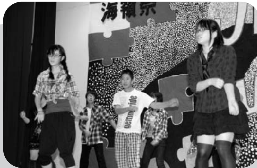
カッコいいダンスやバンド演奏も披露しました