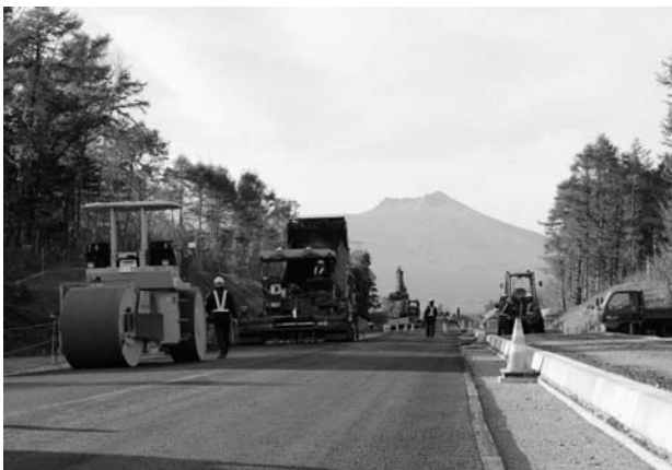
鹿部漁港裏山付近の舗装工事現場