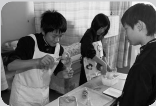
食品販売では生徒が大活躍