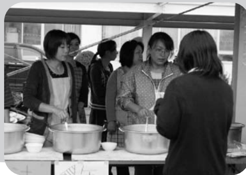
運営には父母や地域の皆さんも協力しました