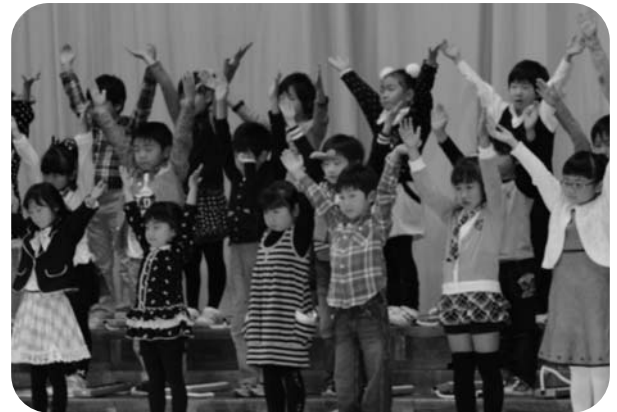
1年生の合唱「ドレミのうた」