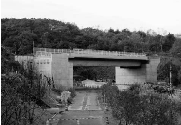
橋梁名：『鹿部公園橋』