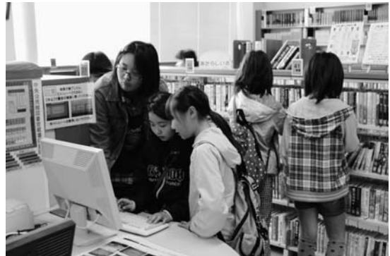
図書検索システムを利用する子ども達 (中央公民館図書室)