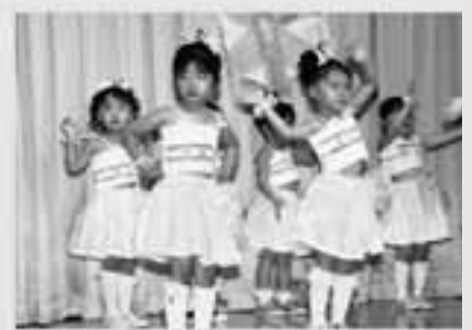
みかん組 遊戯 ハッピー・ジャムジャム にんにんにんじゃ