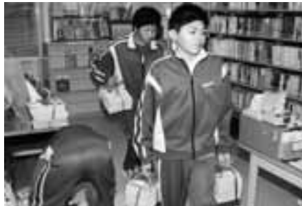
中央公民館で、図書の整理をする生徒