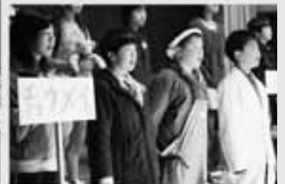
6年生 劇「本当の宝物は」