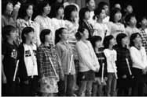
5年生 合唱「広い世界へ」リコーダー「明日があるさ」 器楽合奏「ペコリ・ナイト」