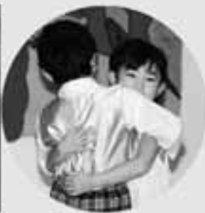
遊戯 白つめ草の花かんむり 海賊ロックンロール