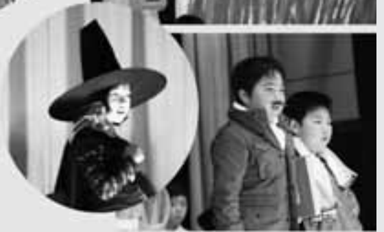
2年生 劇「魔女とぼくらの愛戦争」