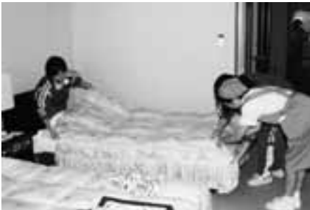
鹿部ロイヤルホテルでベットメイキングの仕事を教わる生徒

そのほかにも、鹿部ロイヤルホテル、総合体育館、中央公民館、鹿部カントリークラブ、役場、渡島リハビリテーション、間歇泉公園、社会福祉協議会及び鹿部漁業協同組合の各事業所にわかれ、貴重な体験をすることができました。