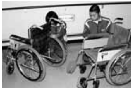
渡島リハビリテーションで、車椅子の手入れをする生徒