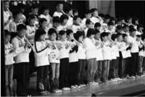
3年生 リコーダー演奏「チャルメラ・ダンス」群読「ことばは心」歌「Tomorrow」 器楽合奏「小さな世界」