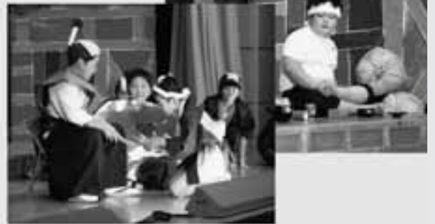
4年生 劇「とんちの繁次郎」