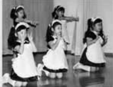
たんぽぽ組 遊戯 氣志團！恋☆カナ