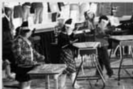
1年生 歌「やまの音楽家」、「たのしいね」 器楽合奏「ドレミの歌」