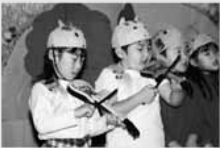
うさぎ組 劇 金のおの、銀のおの