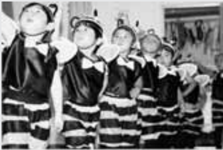
もも組 遊戯 みつばちハッチ