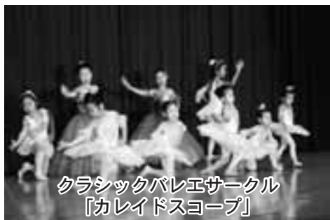
クラシックバレエサークル 『カレイドスコープ』