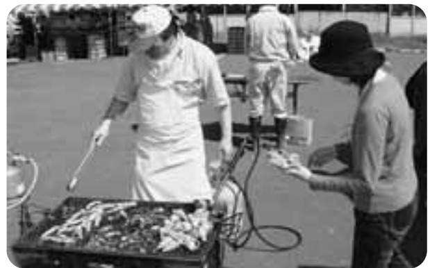
その日水揚げされた魚介類(つぶ、えび、イカなど)を振舞うスタッフ