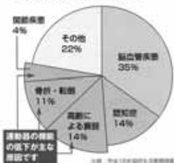
●65歳以上の要介護状態の原因

なまっただままにしておくと、日常生活に支障が出るレベルまで体は衰えてしまいがちですが、運動などで意識的に体を鍛えることで、何歳であつても筋肉を鍛えることができます。さらに、持久力や柔軟性、バランス能力なども回復することができますのです。これからは「もう年だから」ではなく、「いつからでも大丈夫」と心持ちを変え、あきらめずに意識的に体を使い、鍛えるようにしていきましょう。