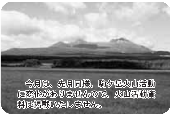
今月は、先月同様、駒ヶ岳火山活動に変化がありませんので、火山活動資料は掲載いたしません。

なお、会社や役所、学校などに勤めている方とその被扶養配偶者の方については、勤務先で手続きが行われますので、自分で行う必要はありません。