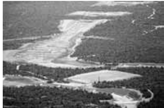
駒ヶ岳演習場砂防ダム