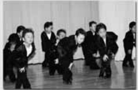
りす組 遊戯 一世風靡セピア