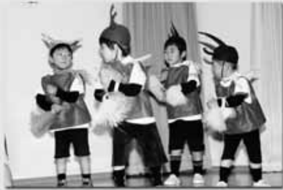
もも組 遊戯 ムシキング・サンバ!