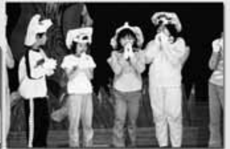
4年生 劇「八ばけずきん」