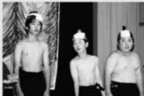
6年生 劇「まぬけな山賊たち」