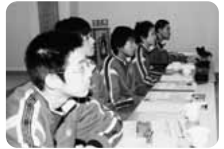
説明を真剣に聞く生徒

役場建設水道課では、普段何気なしに通学している町道の除草作業や日常生活で飲んでいる水などについて、職員から説明を受けました。 また、今実際進められている事業の内容「町道及びバイパス」「地籍調査事業」「砂防ダム」など業務内容説明など聞き最後に、鹿部町に関する学習会として、簡単なクイズ形式で鹿部町について学びました。