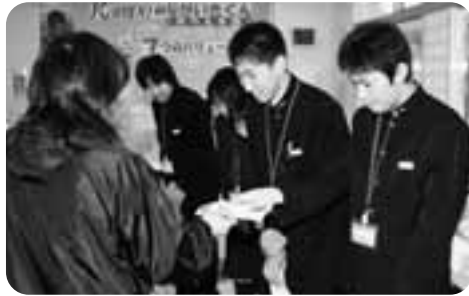
鹿部郵便局で年賀はがきのチラシを配る生徒

近年、少子高齢化社会の到来、産業・経済の構造的変化や雇用の多様化・流動化等を背景として、将来への不透明さが増幅するとともに、就職・心学を問わず進路をめぐる環境は大きく変化する中、児童生徒が「生きる力」を身に付け、厳しい社会の変化に対応し、主体的に自分の進路を選択・決定できるなど、社会人・職業人として自立していくことができるようにするキャリア教育の推進が強く求められています。 このようなことから文部科学省が本年度から「キャリア・スタート・ウィーク推進事業」を始めました。 渡島管内では、当町のほか2町4校が実施する