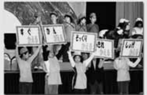
2年生 「かえるの王さまひっくりかえる」 いろんな、かえる言葉をならべる!