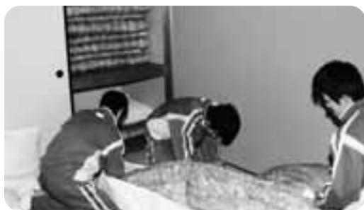
ベットメイキングをする生徒

しかべ間歌泉公園では、来園者への券売業務や館内の清掃のほか、来園された方々へ親切に施設案内など色々な業務を4人で一生懸命頑張っていました。 券の販売時には、親身