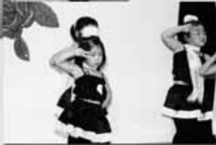
遊戯 キューティーハニー