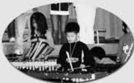
5年生 音楽 歌「きみをのせて」 器楽合奏 「ルパン三世のテーマ」