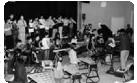
小学5年生による器楽合奏、演奏曲は「ルパン三世のテーマ」