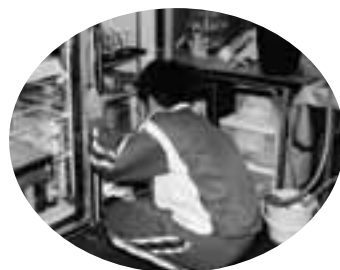
厨房の冷蔵庫など隅から隅まで拭き掃除する生徒

鹿部ロイヤルホテルでは、各階のベットメイキングなど普段では目に見えない作業を体験し、また、カントリークラブでは、ゴルフバックの積み下ろしや食堂の清掃など戸惑