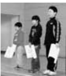
北海道教育委員会教育長賞、郵政公社北海道支社貯金事業部長賞を授与された3名