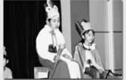
ちよつと緊張気味の王 さまとお妃さま