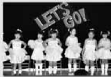
遊戯 Let's GO いいことあるさ!