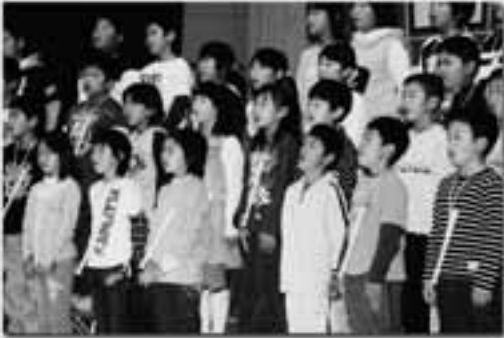
3年生 音楽「音楽のおくりもの」リコーダー合奏 「レッツ・ゴー」「雨上がりの朝」など・・・