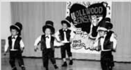
たんぽぽ組 遊戯 デイドリーム ヒーロー