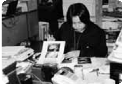
写真を貼り付ける手伝いをする生徒

鹿部漁業協同組合では、基幹産業が漁業であることから漁師にはなくてはならない事業所であり、その中で体験学習に行つた生徒たちは、事業部で損害保険の申請書類を作成する手伝いやパソコンに向かつて一生懸命書類を作りました。信用部では、窓口業務や電話の対応を色々教わつたり、各部会での事業を学びました。