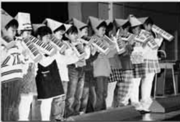
1年生 音楽ディズニーより 歌と器楽合奏「ハイホー」