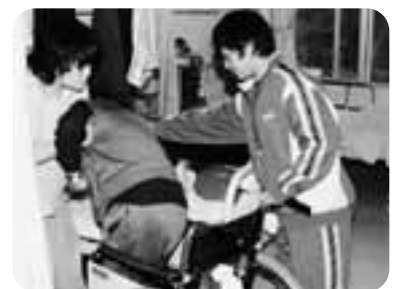
介護の補助をする生徒