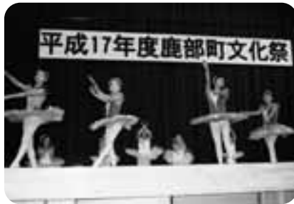
バレエサークルによる「四季の詩」