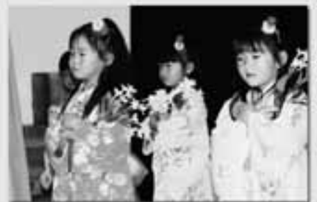
さくら組 遊戯 忘れな草