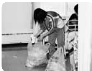
ごみを片付ける生徒