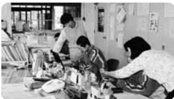
教育委員会で職員にパソコン操作を教わる生徒

にお客さんへの対応の仕方やおつりの出し方など普段では学べないことを色々と教わっていました。