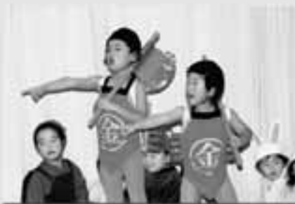
りす組 劇 きんたろう