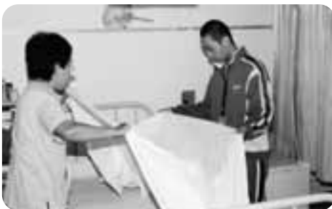
寮母と一緒にシーツ取替える生徒

渡島福祉会では、一番多くの生徒が体験学習に行き、少子高齢化の進む中、重要な施設での体験となりました。 療護部、更生部、特別養護老人ホーム、デイサービス、など5箇所に各2名づつ配置し、更生部ではシーツの取替えや車椅子へ乗せるときの補助員になったり、各部屋の清掃や廊下の掃除、また、デイサービスでは、生徒が自分で作ってきた簡単な問題でお年寄りと一緒に楽しく過ごす姿がありました。普段では体験のできない貴重な経験をしていました。