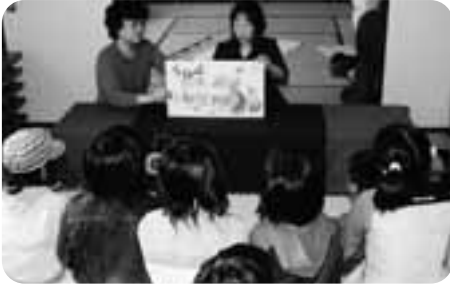
おはなしライブラリー

幼小中、陶芸、水墨画、刺繍、写真など色々な展示発表をはじめ、体験コーナーでは、押花体験、おはなしライブラリー、七宝焼体験など子供からお年寄りまで楽しめるコーナーもあり楽しい一時を過していました。