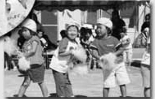
たまごまごまご うまく踊れてる?