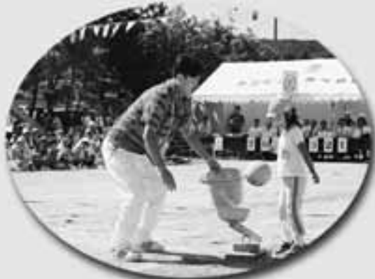
親子でナイスキャッチ! お父さんうまくとれるなか?