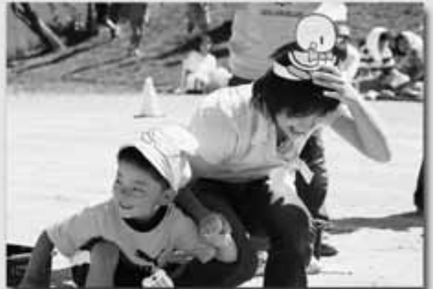
お母さんといっしょ