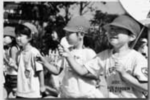
かけっこです。ヨ～イ ドン!