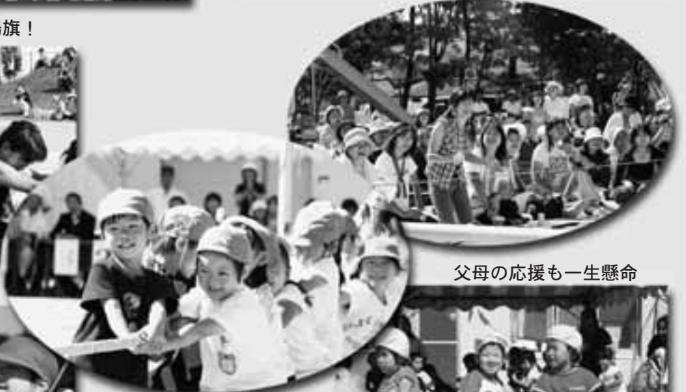
父母の応援も一生懸命