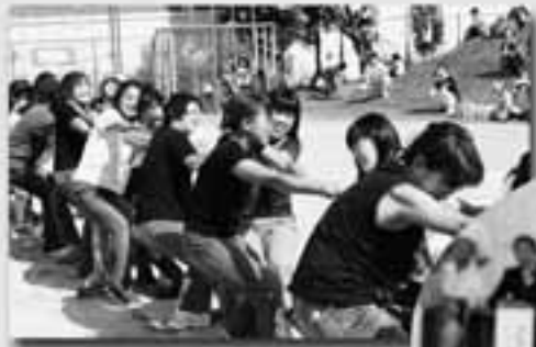
お母さんたちも力いっぱい!