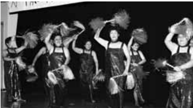
出来潤婦人消防隊による『まつけんサンバ』

今年の余興は、出来潤婦人消防隊による歌や踊り、鹿部町藤間会による日本舞踊、個人の方からは一名が詩い二名