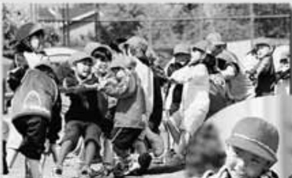
白組に負けるな～引っぱれ