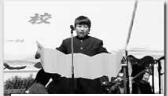
白組が勝つか？紅組が勝つか？勝負！！