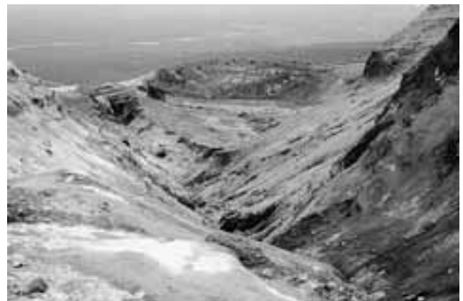
鹿部押出沢源流部