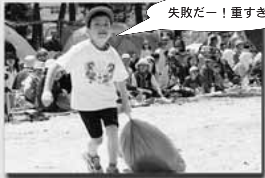
失敗だー!重すぎる