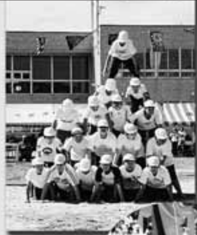
6年生最後の運動会上手くきめれるか?