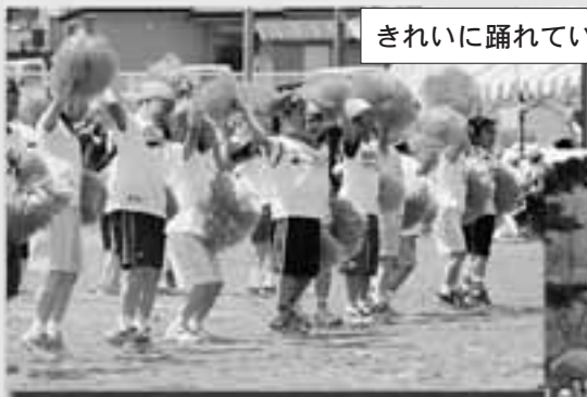
きれいに踊れているかな~?