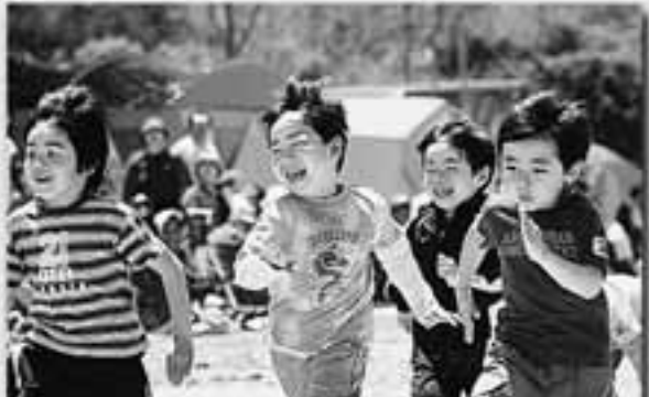
来年1年生 お兄ちゃん、お姉ちゃんに負けなぞ!