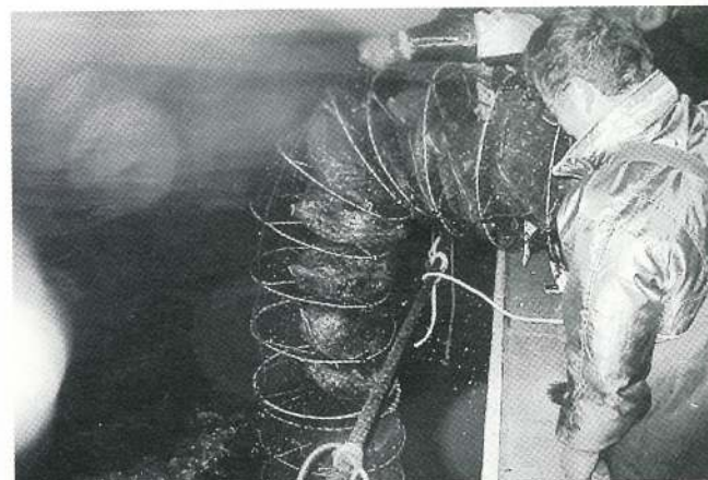
④養殖施設への吊り下げ作業