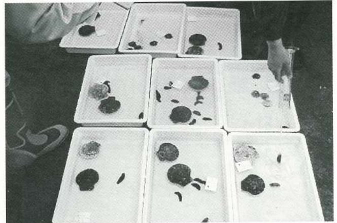
①作業前のナマコとホタテ貝