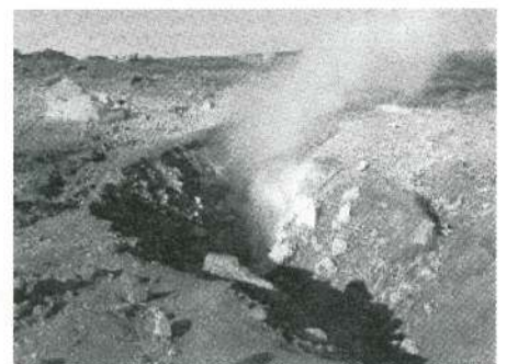
96年南火口列F13噴気孔の様子 (南側から撮影：10月31日)