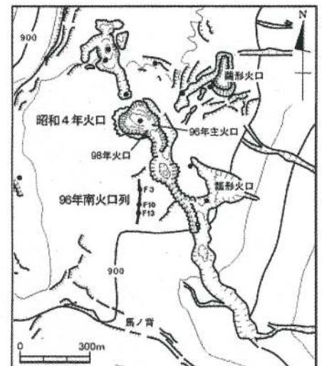
北海道駒ヶ岳山頂火口周辺図