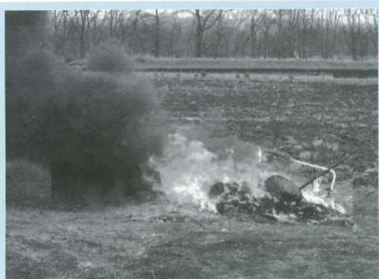
野焼きの例…このような焼却は違反です!