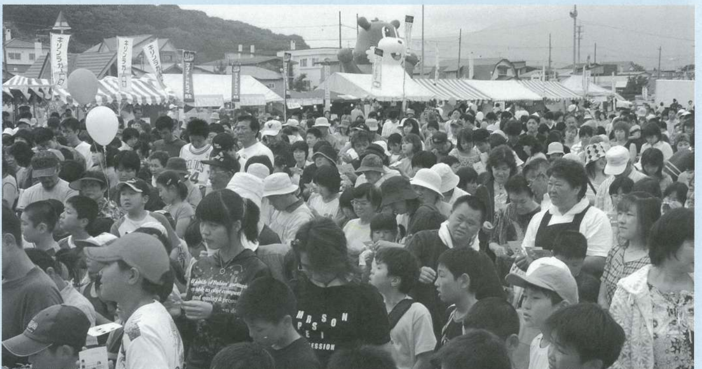
温泉ピンピンビンゴ