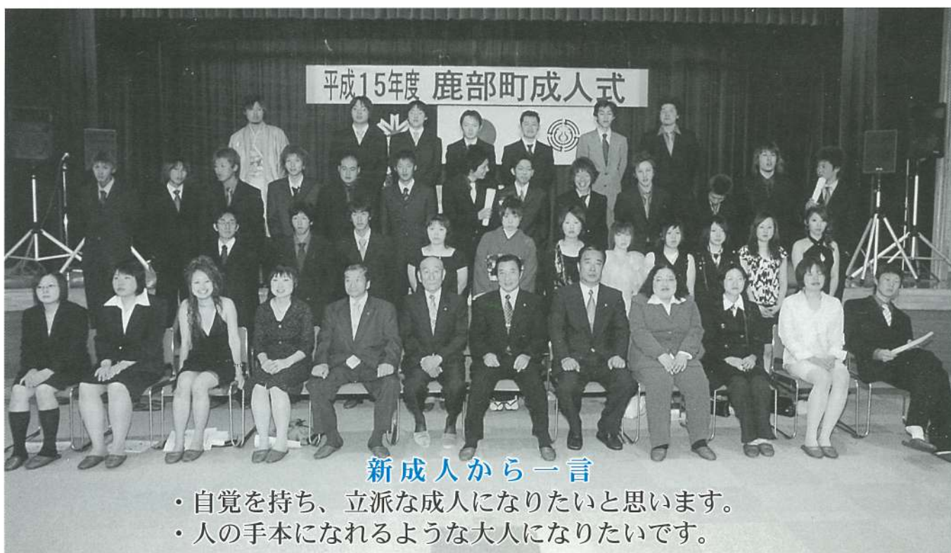
平成15年度 鹿部町成人式