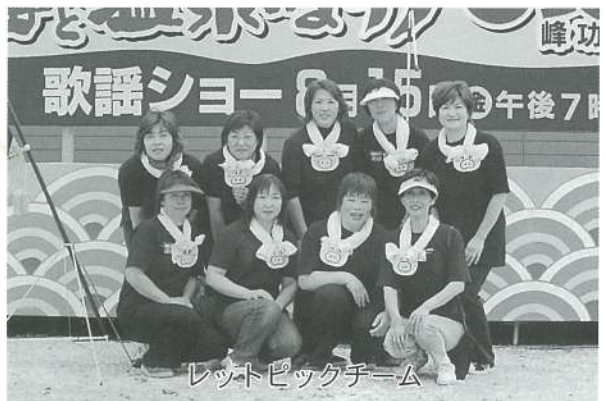
レットピックチーム