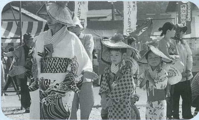
海と温泉のまつり音頭