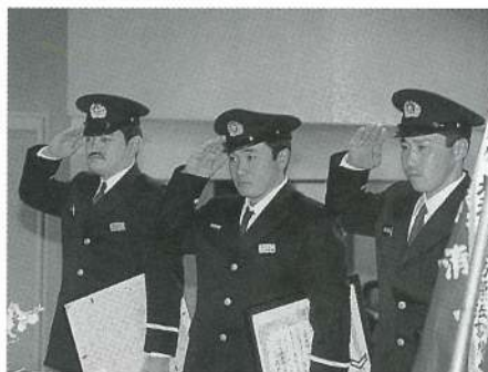
▲表彰伝達式の様子▼

◇ ◇ ◇ この度の受賞、誠に おめでとうございます。 受賞された方々の益々 のご活躍を期待して おります。