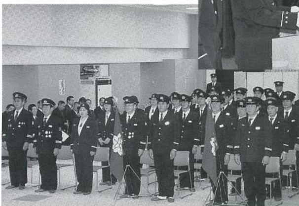
▲式典に参加された団員のみなさん