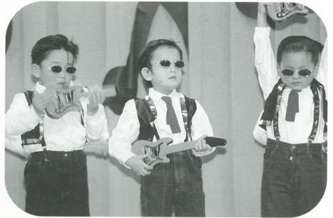
〔年少〕 はちのこロックンローラー