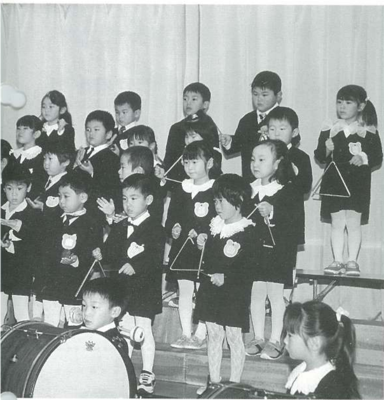
〔年少〕 ミッキーマウスマーチ