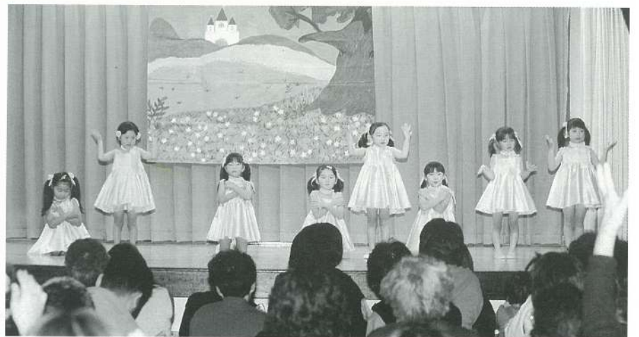
〔年少〕 フラワー・ギャル