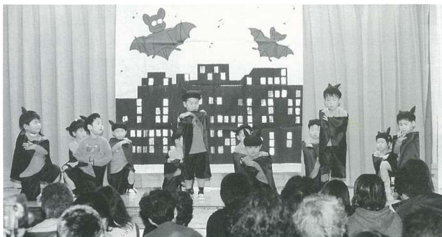
〔年少〕 こうもりロックンロール