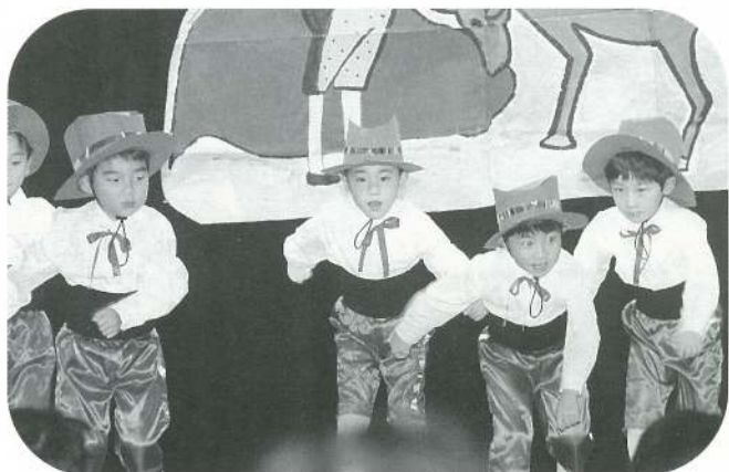
〔年長〕 スペイン・ファンタジー