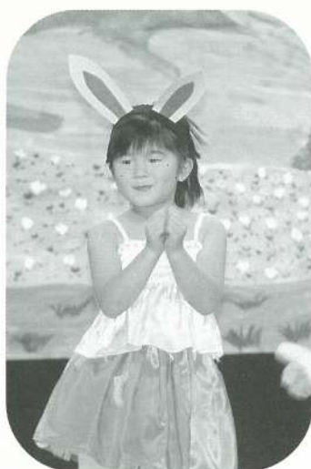
〔年長〕 ウルトラうさぎ