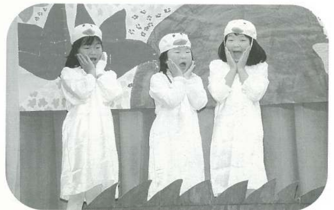
〔年長〕 みにくいあひるの子