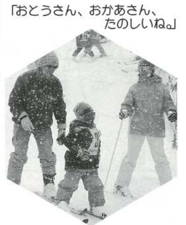
「おとうさん、おかあさん、 たのしいね。」