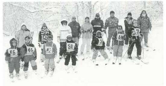
全員で、はいポーズ