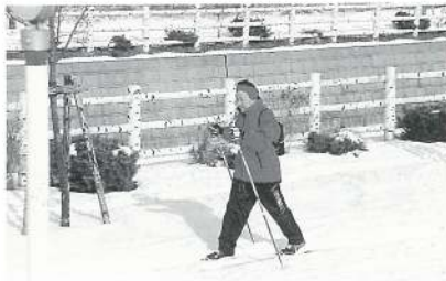
鹿部川の川添をのんびりと。