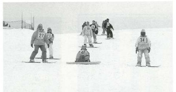
僕たち、私たちも緊張しながら。 ザザー ザザー。