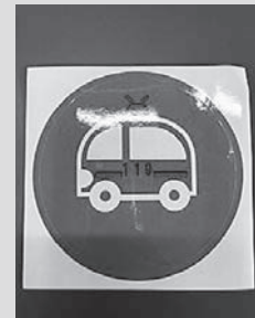
保管マーク（玄関用）