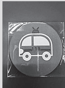
保管マーク（冷蔵庫用）

救急隊員などに救急カードを保管していることが一目でわかるよう、保管マークを冷蔵庫と玄関に貼ります。(冷蔵庫用の保管マークはマグネット式、玄関用の保管マークはシール式になっています。)