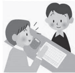
早めの相談が大切です

災害、病気、失業や事業の経営不振など、やむを得ない理由で一時的に町税などを納期限までに納付することが困難な人については、納期限内に税務課へ連絡して下さい。収支の状況、生活状況などを確認した上で、納税相談に応じます。面倒臭いと後回しにしていると、滞納額が増え、差押えを受けることにより、滞納者は経済的な不利益を被るだけでなく、社会的信用も失うこととなります。そうならないためにも、早めの納税相談をお願いします。