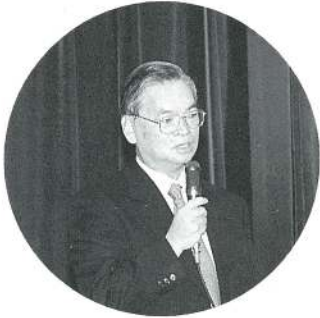
小川園長先生のあいさつ