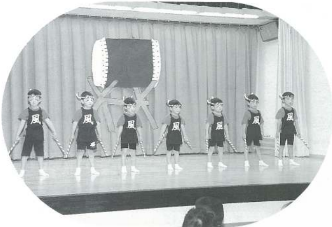
すみれ組 (遊戯) 風太鼓