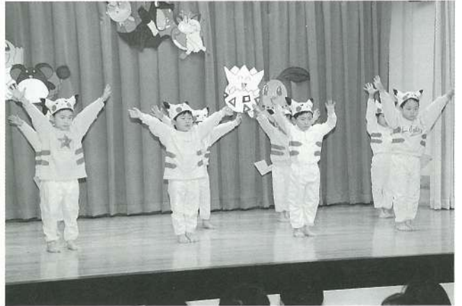
たんぼ組（遊戯）ポケモンピカチュウ