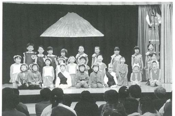
うさぎ組 (遊戯) むかし海賊がいたとき