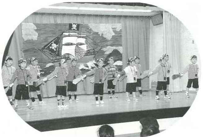
あひる組 (劇) 孫悟空・おわりの言葉