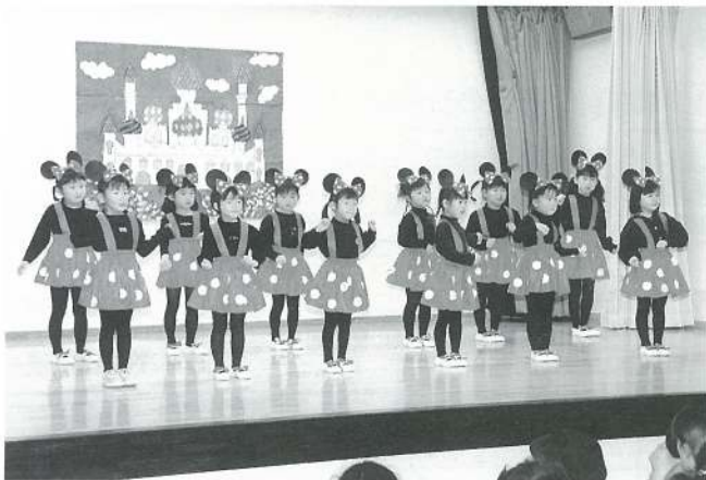
たんぼぼ組 (遊戯) ハッピーマウス