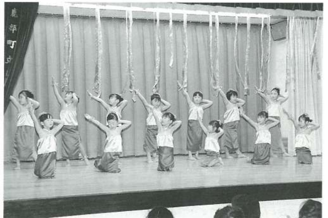
うさぎ組 (遊戯) おまつり人魚