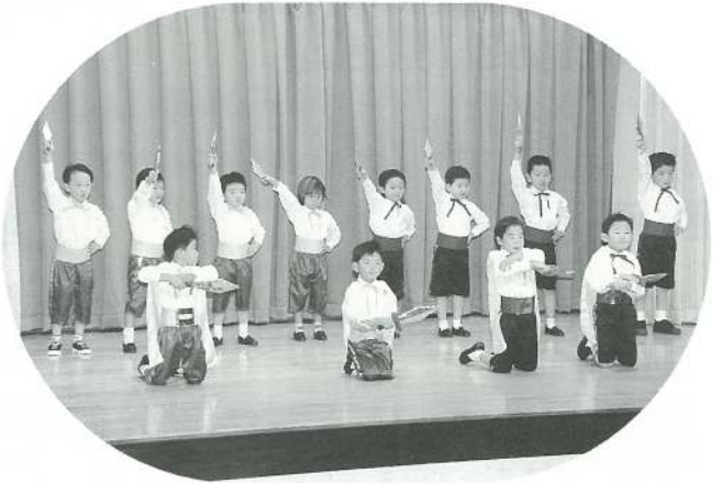
あひる組（遊戯）雪王子風王子