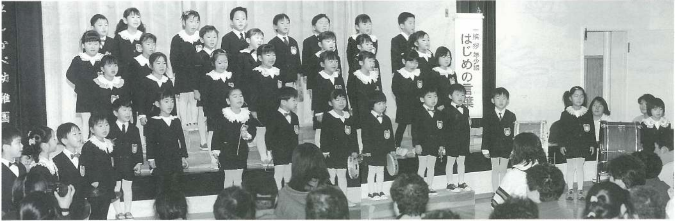
はじめの言葉・慎吾ママのオハロック（合奏）・不思議なポケット（歌）