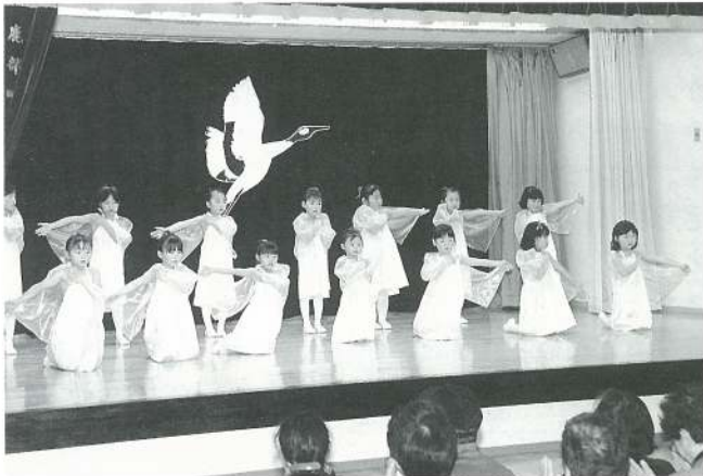
あひる組（遊戯）鶴の舞