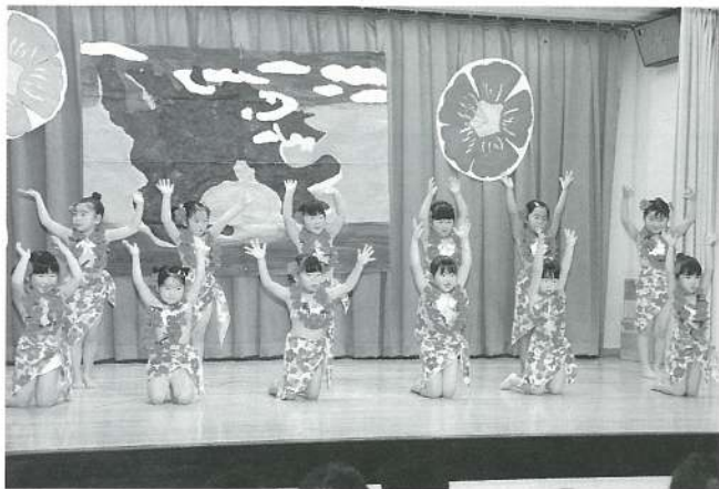
すみれ組 (遊戯) 島の花踊り