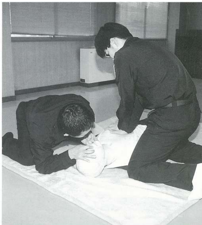
CPR訓練人形マット付1台（実践を想定した訓練の様様）