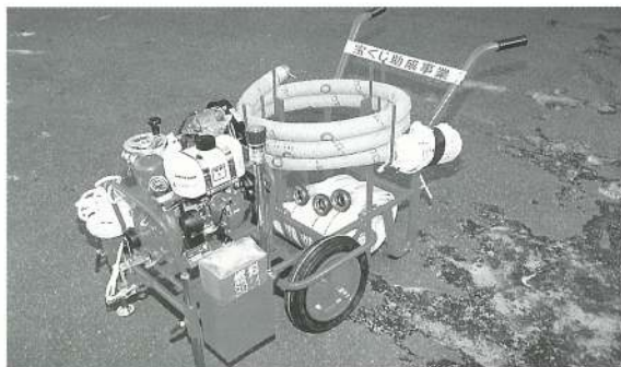
D-1級軽可搬消防ポンプ組立水槽付1台

災害発生時の活動にあたって、婦人が対応できる軽可搬消防ポンプの導入が得られ、地域住民の防災行動の向上を図るとともに、火災の拡大を防ぐため初期消火の体制に万全を期するものです。 今回の購入により一層安全で災害に強い地域づくり活動が充実されることが期待されます。