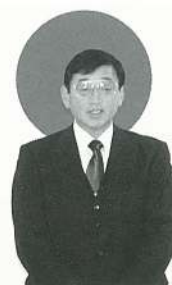
松本教育委員長挨拶