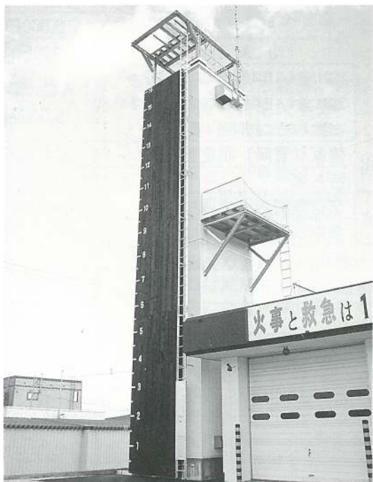
完成したホース乾燥施設 外壁を利用し、日常訓練にも一役

消防署・団が災害等で使用した消防用ホースの乾燥、整理を消防署において一括処理するため、本年度において、道の地域政策補助金を受けて、室内型ホース昇降装置の設置により作業の安全性及び省力化が確保され、また外壁を利用した日常の訓練と合わせて、今後いつそうの消防力強化が図られます。