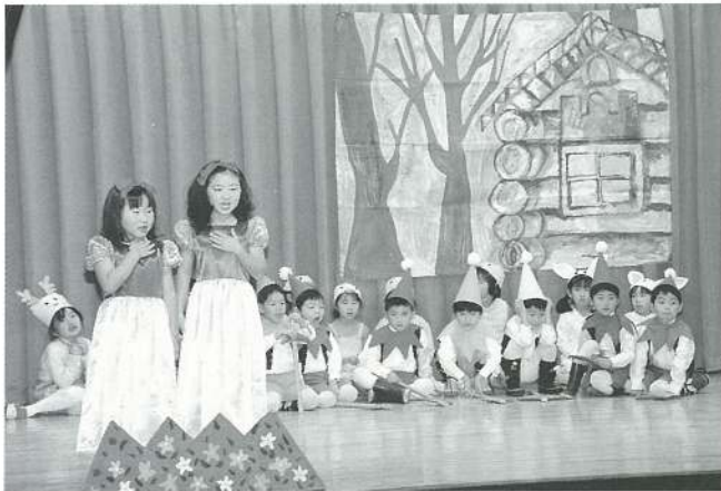
うさぎ組（劇）白雪姫