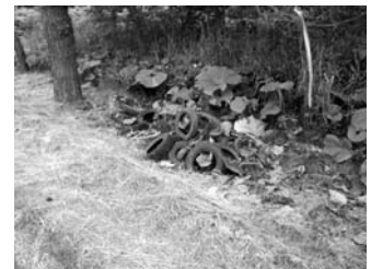
平成22年度に町内で発見された不法投棄現場の写真