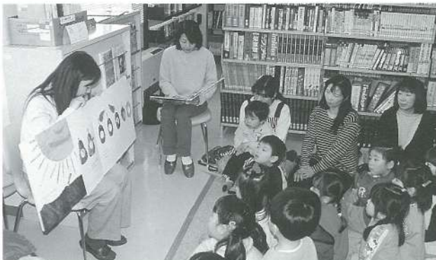
大きな絵本「はらべこあおむし」にみんな注目！！

今年2000年は子ども読書年です。ご家庭でもできる読み聞かせをぜひこの機会にやってみませんか。