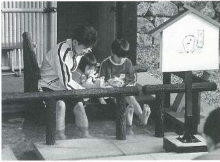
「足湯」を楽しむ親子づれ