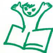
2000年は、子ども読書年

また、「おはなしライブラリー」では、ボランティアで絵本を読んでいただける方を募集しています。年齢・性別・経験は問いません。絵本が好きな方ならどなたでも大歓迎です。午後の時間を子どもたちと絵本を読んですごしませんか？