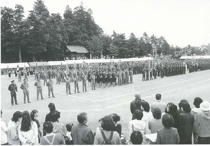
昨年の七飯町大会より……

この大会は、渡島管内十七市町村の消防団員が一堂に会し、小隊訓練やポンプ操法など日頃の訓練の成果を披露する大会です。 鹿部町での開催は、昭和五十八年以来十七年ぶりとなります。 当日は、消防団員や関係者など約千名の参加が予定されております。 また、各市町村の消防団員、婦人消防隊による会場行進やYOSAKOIソーラン（鹿部無双）、はしご乗り演技のアトラクションも行います。町民皆様のご参観をお待ちしております。