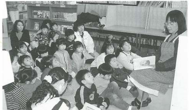
「おまつりの日のさようなら」は主人公の気持ちになってちょっとさびしい？