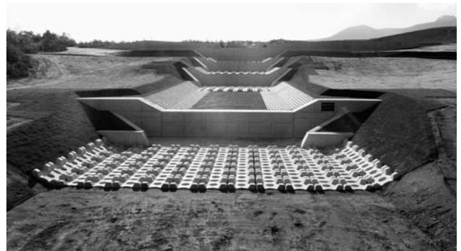
平成22年度で完了した駒ヶ岳演習場砂防ダム