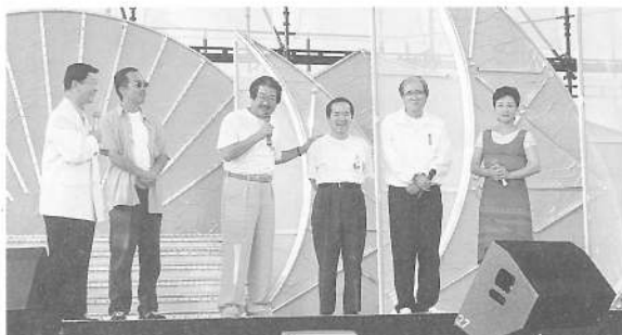
激励にかけつけた、作詞家・作曲家のみなさん