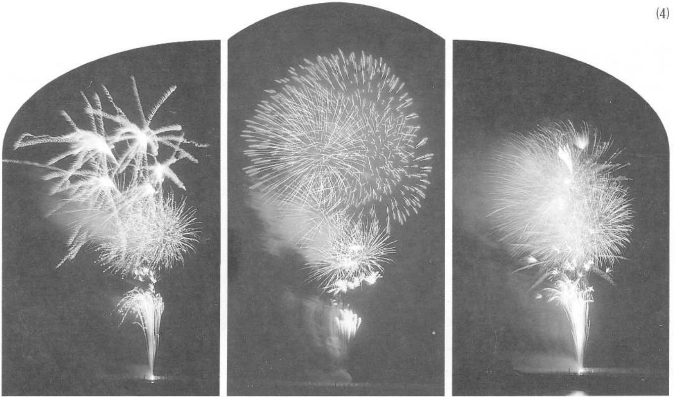
夜空のキャンパスに描き出される一夜だけの芸術作品