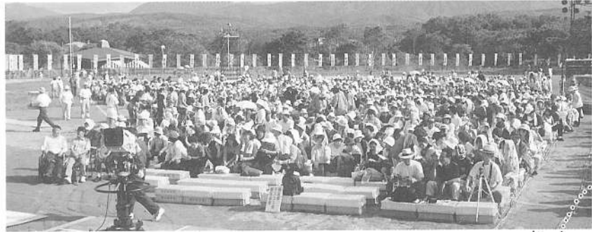
会場には町内外より大勢の観客の方々が集まりました。