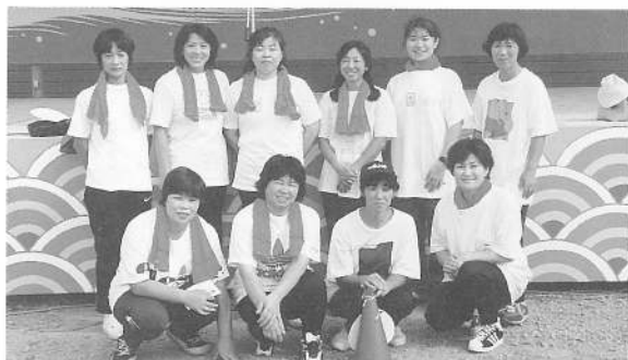
カッター競技優勝 (女子の部) 鹿部レディース Aチーム