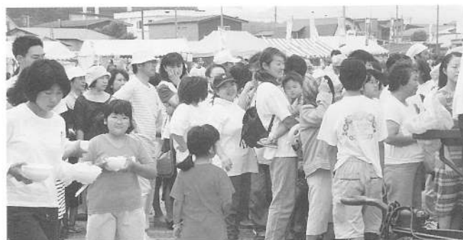
今年も人気となったスリミ汁サービスに長蛇の列