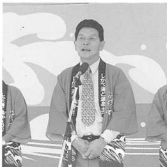
松川実行委員会会長あいさつ (町内会 連合会会長)