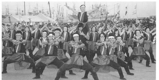
函館躍魂いさり火