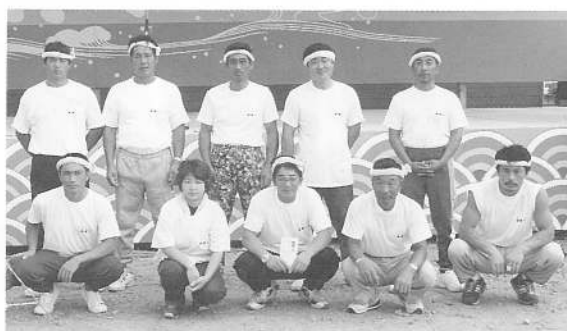
カッター競技優勝 (男子の部) 宮 浜 Aチーム