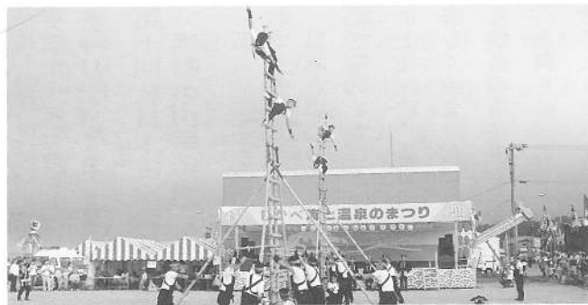
勇壮な、はしご乗り演技披露