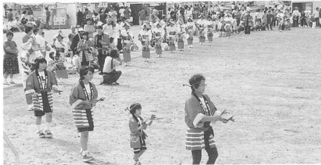
まつり気分盛り上げに一役、婦人部の皆様による、踊り