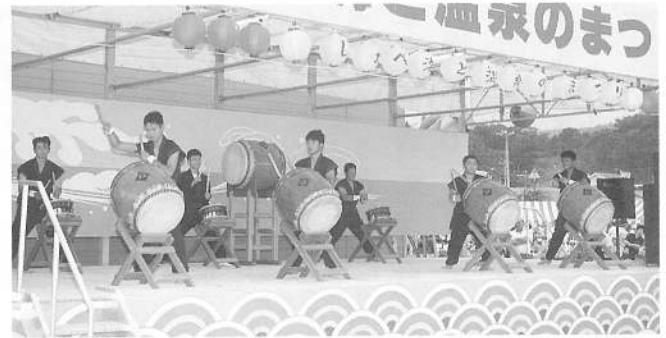
迫力あふれるバチさばき、鹿部太鼓演奏