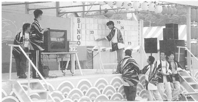
お目当ての賞品が当たるといいな、ビンゴゲーム