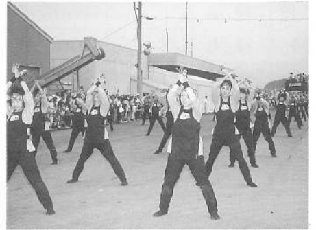
華麗な踊りで観客を魅了よさこいソーラン踊り、浜踊人「鹿部無双チーム」