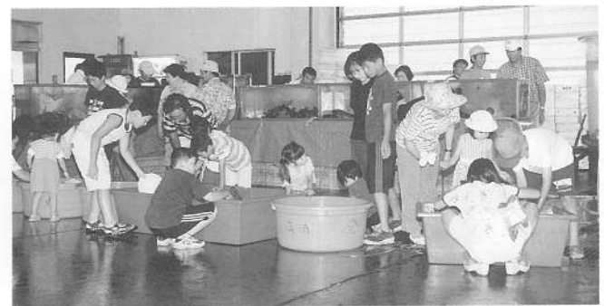
魚とのふれあい、ふれあい水族館