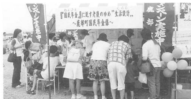
国民年金キャンペーン実施、年金コーナー