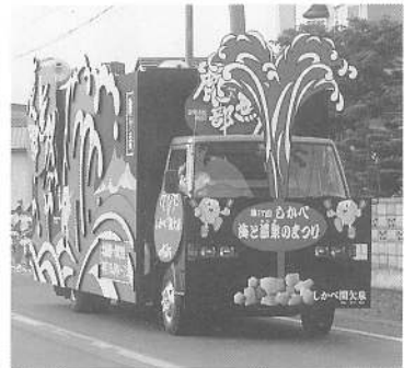
まつりに華をそえた町内会婦人部、リハビリ女子職員による踊り（町内パレードの様）