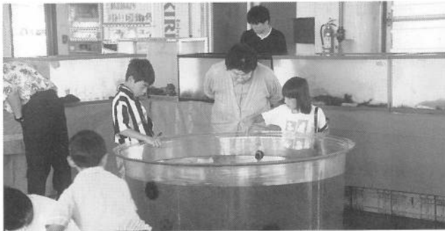
お孫さんといっしょに ふれあい水族館