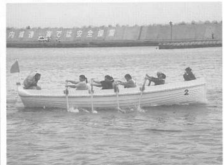
カッター競技を戦った勇士たち