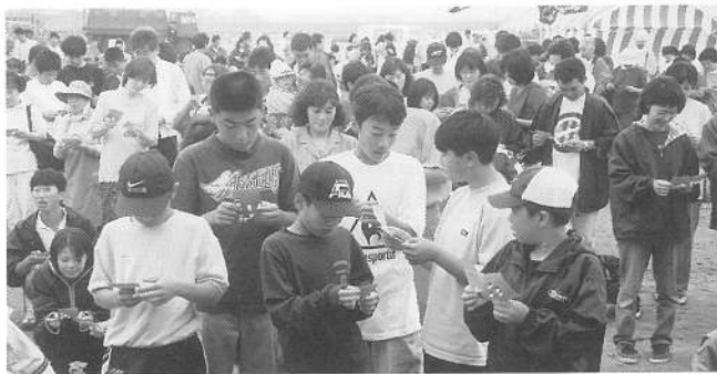
お目当ての賞品が当たるといいな、ビンゴゲーム