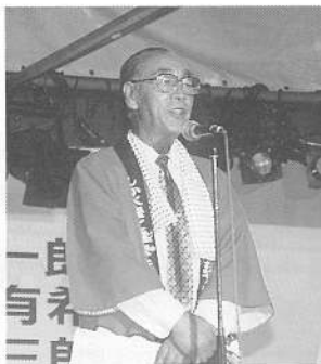
相澤大会長あいさつ(町長)