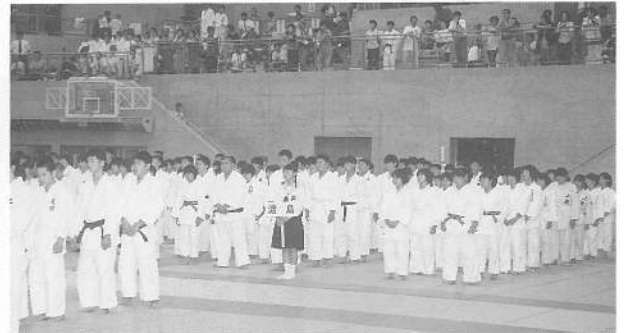
渡島支庁管内代表のみなさん