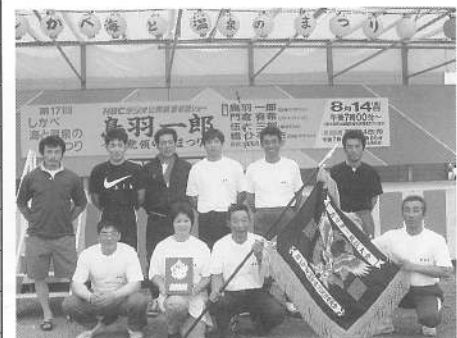
カッター競技優勝（男子の部）宮浜Aチーム