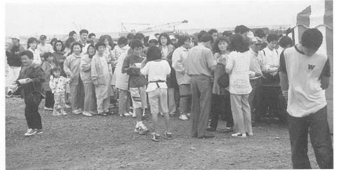
今年も人気となったスリミ汁サービスに長蛇の列