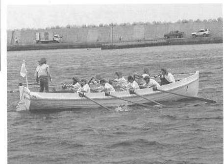
男性に負けないオールさばき、鹿部レディース