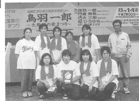
カッター競技優勝（女子の部）鹿部レディース