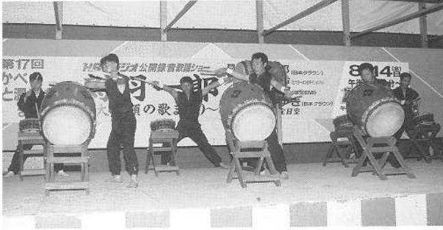
迫力あふれるパチさばき 鹿部太鼓・鹿部ジュニア太鼓演奏披露