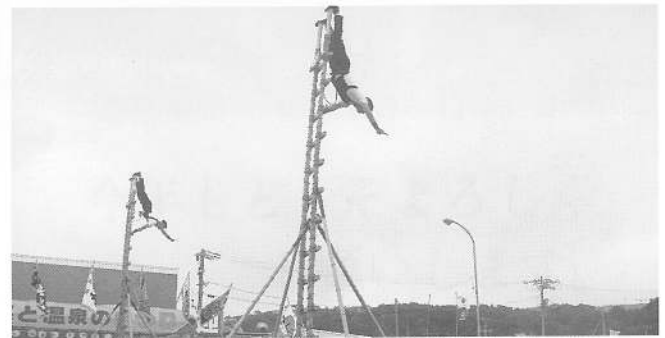
勇壮な、はしご乗り演技披露