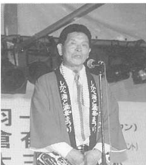
松川実行委員会長あいさつ (町内会連合会会長)