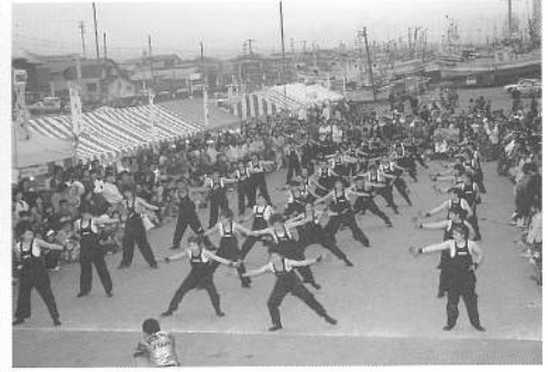
華麗な踊りで観客を魅了 よさこいソーラン踊り、浜踊人「鹿部無双チーム」