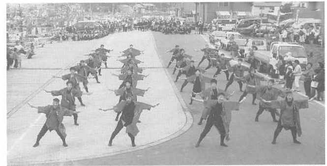
まつり気分盛り上げに一役、応援にかけつけたよさこいチーム（大野YOSAKOI 乱舞如来・SA-KOIもり）