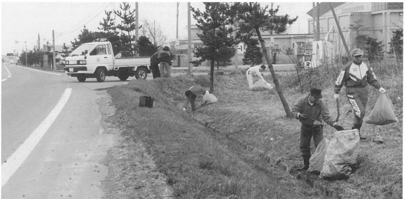
道々大沼公園鹿部線ゴミ捨より