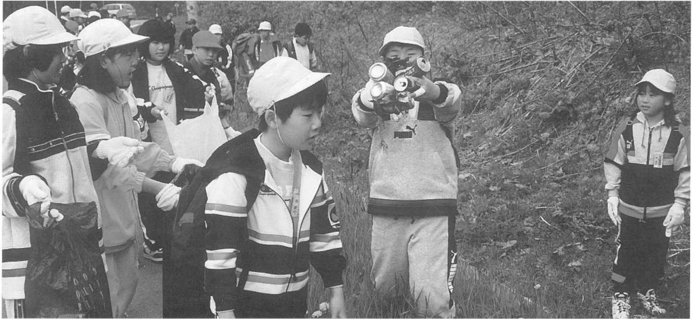
道々大沼公園鹿部線ゴミ捨より