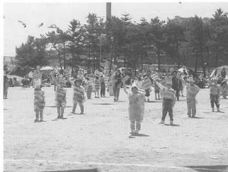
しましまロックン体操 (2年生)