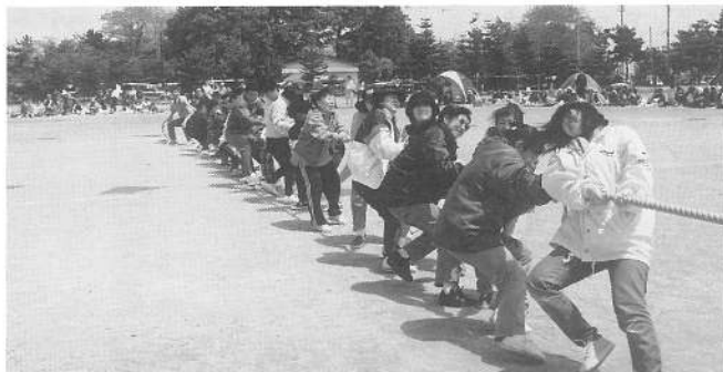
地区対抗綱引き合戦 (PTA)