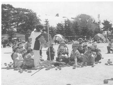
玉にまけるな (1年生)