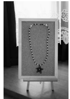
ペーパークイリング作品