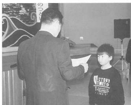
入選標語表彰式の模様