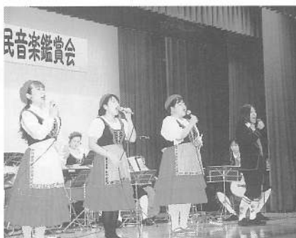
ハート音楽院アンサンブルによる歌と踊り