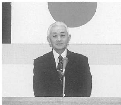
坂井教育委員長 あいさつ