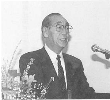
来賓挨拶 鹿部町長

講演終了後、父兄の方々に感想を聞いたところ「ユーモアたっぷりで笑いも多く、時間のたつのも忘れまして」などの感想が数多く寄せられました。