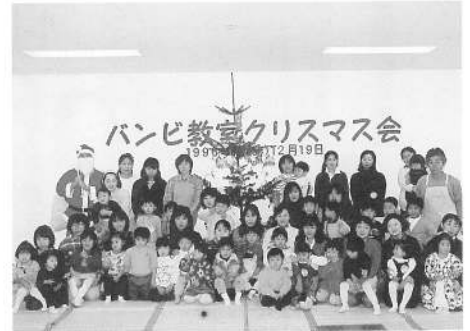
平成8年12月のバンビ教室より

1月30日(休)に行われた3歳児健診で、次の9名のお子さんは、むし歯が1本もありませんでした。これからも歯みがきを頑張って、むし歯をつくらないようにしましょう。