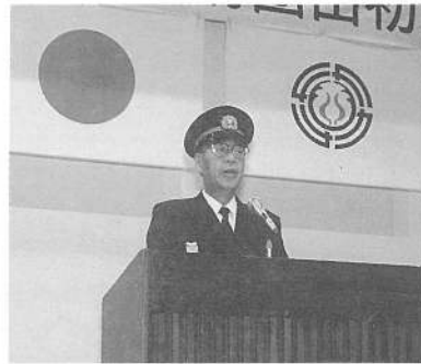
管理者代行挨拶 鹿部町長