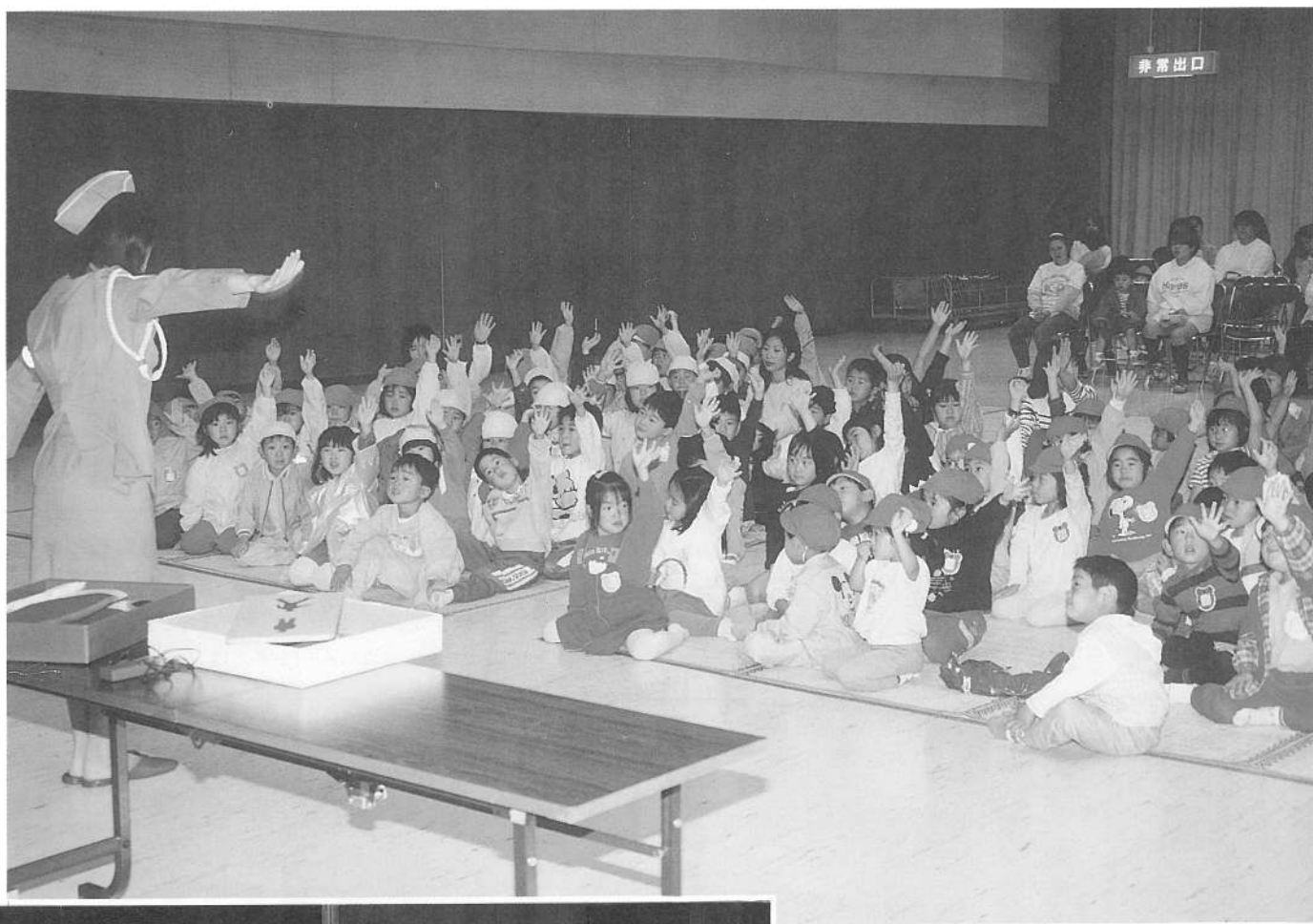
7/9日 母と子の交通安全教室より