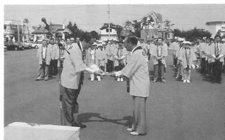
交通事故撲滅を願って 鹿部建設業協会より御寄付の贈呈

みなさん、鹿部町の交通事故撲滅を願う町民一人ひとりの力を合わせてがんばりましょう。また、大会終了後、鹿部町並びに交通安全推進関係団体主催による交通事故死撲滅を願う、山村広場に会場を移しパークゴルフ大会も開催されました。