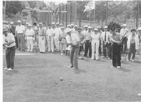
パークゴルフ大会始球式