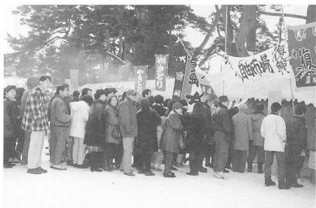
ホタテ即売会場、長蛇の列

再建を急ぐ函館自由市場へ二月十日、 鹿部漁協ホタテ部会が五稜郭公園で義 援金を贈るためホタテを販売いたしま した。「頑張れ自由市場」と銘打った ホタテ即売会ではたいへんなにぎわい を見せておりました。 一日も早い再建をお祈りいたします。 ガンバレ自由市場!!