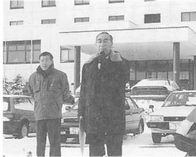
大会長あいさつ 相澤町長