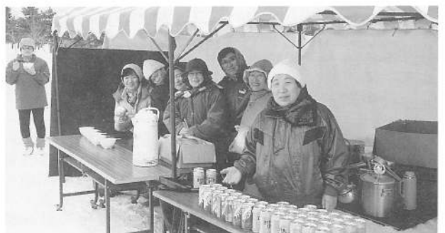
“冷たい飲みものと温かいブタ汁はいかが” ゴール後選手たちへふるまう婦人部のみなさん