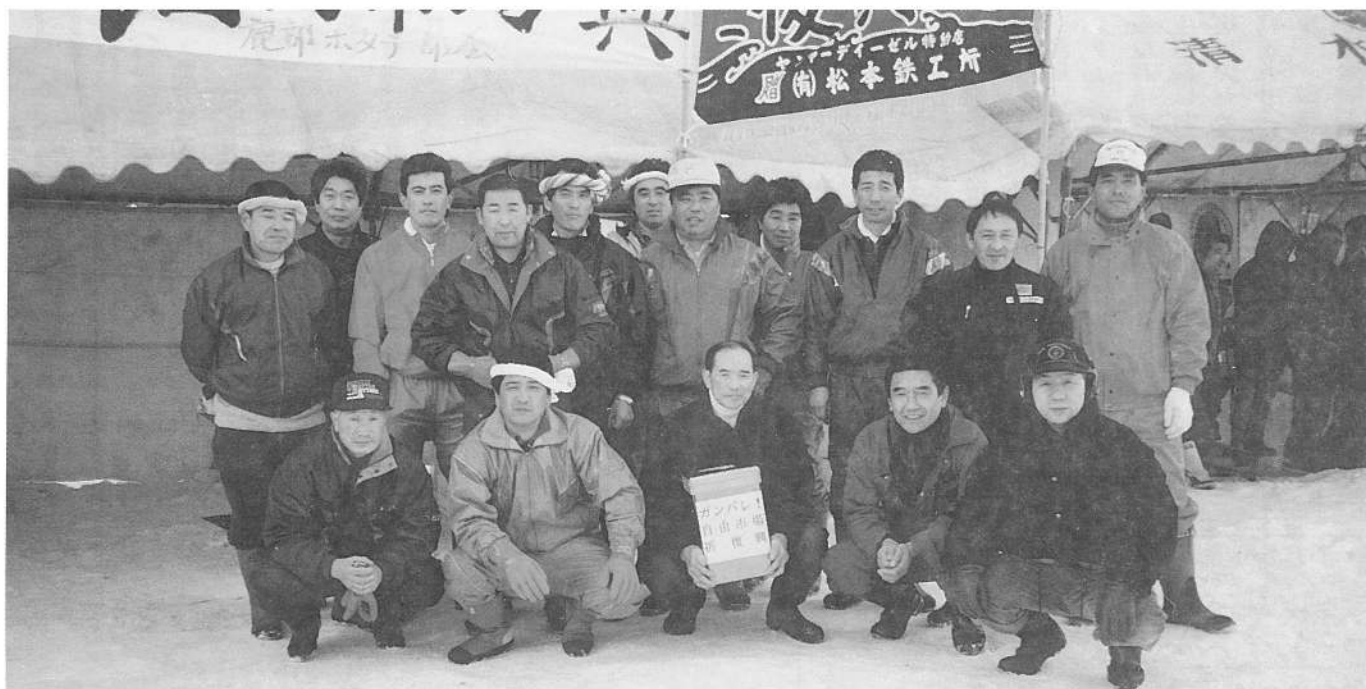
火災で被災した函館自由市場へ再建支援のため 鹿部漁協ホタテ部会員が一役