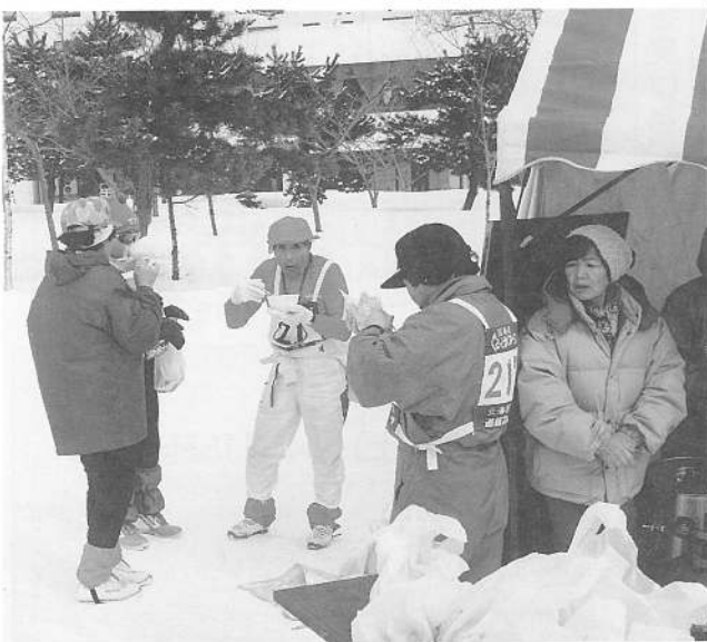
汗をかいたあとの“ブタ汁” 体があたたまりますね〜 完走して満足・満足