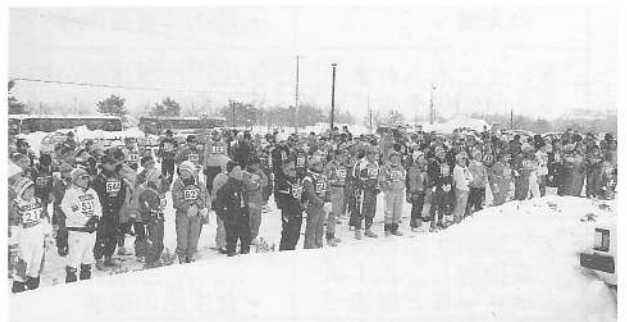
鹿部ロイヤルホテル前(メイン会場) 開 会 式

さらに“テクノポリス函館”を核とした企業誘致も進み、躍動する産業の息吹が町に活性化をもたらしている。