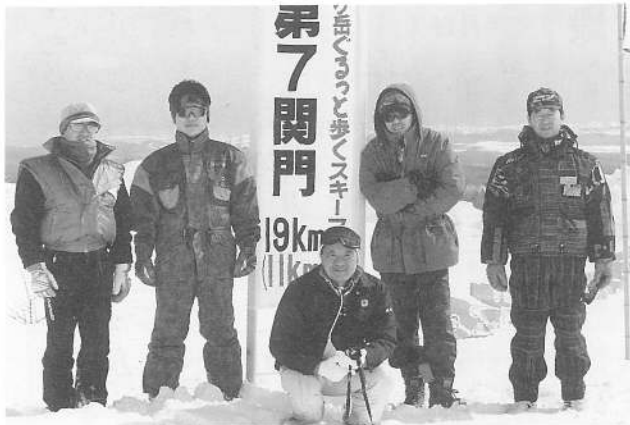
選手たちの動向を見守るスタッフたち 鹿部寄り第7関門地点にて