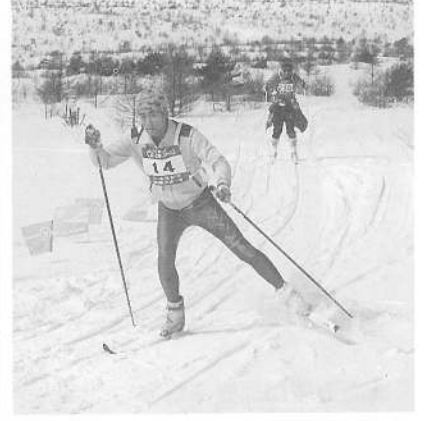
第7関門めざして 只今滑走中 軽快な走りをご覧下さい