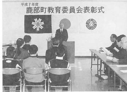
坂井教育委員長あいさつ