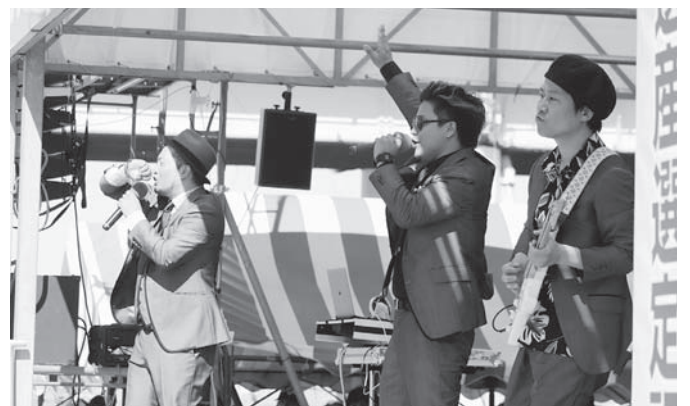
「アダンスサークルAngel」 「DEEP BEAT」 ダンスパフォーマンス