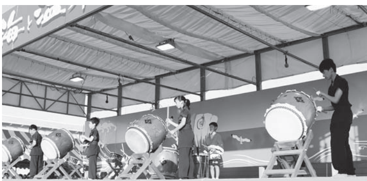
「鹿部ジュニア太鼓」太鼓ライブ