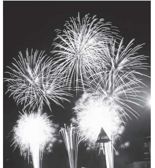
およそ3500発の花火が鹿部の夜空を彩りました。