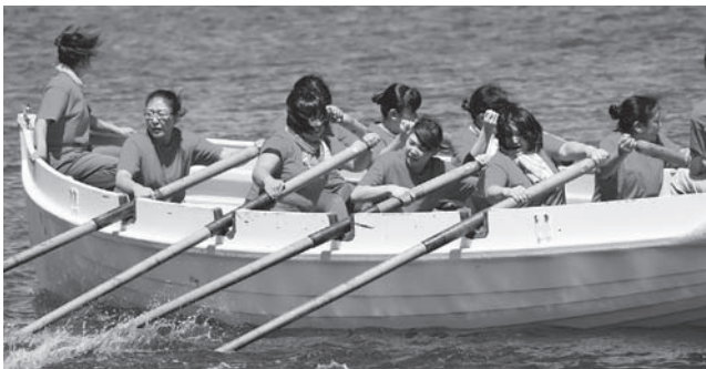
【女子の部優勝】渡島リハビリテーションセンター女子

今年のカッター競漕大会は、強風の中での開催となりましたが、男子の部17チーム、女子の部5チームが出場し、熱戦が繰り広げられました。コースは片道90mの距離を往復、選手たちのかけ声と見事なオールさばきに、会場からは声援が送られていました。