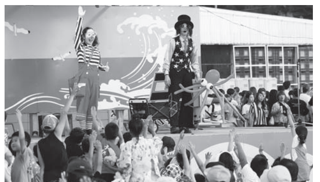
「トイシアター」パフォーマンスショー