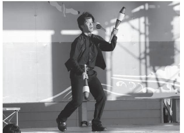
「アット」スペシャルジャグリングショー