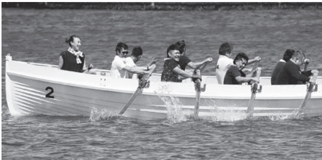
【男子の部優勝】オーシャンズ