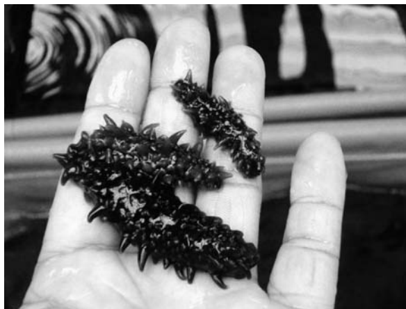
大きく成長した稚ナマコ

※ 残留率について、ネット中の%は15.8%と低くなっておりますが、大きく成長しているものに関しては保育礁周辺（コンブやフトン籠）への分布が多くみられました。