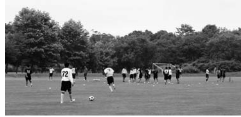
多目的グラウンドで練習する東海大付属第四高校の生徒たち