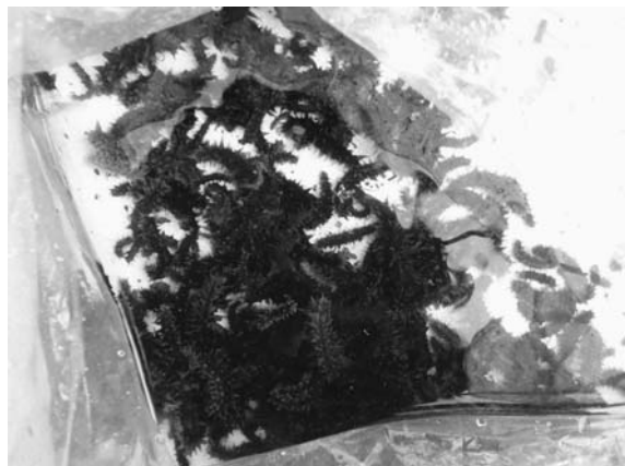
保育礁周辺に分布していた稚ナマコの一部