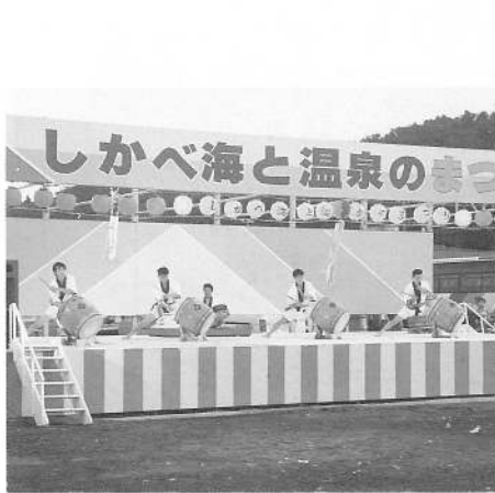
迫力あふれる「鹿部太鼓」