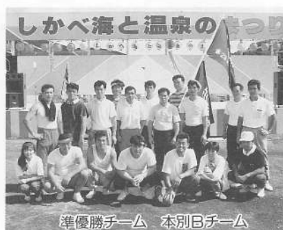
準優勝チーム 本別Bチーム