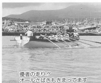
優者の走り!! オールさばきもきまっています

カッター競技の結果(2回の合計タイム) 優勝—6分20秒 準優勝—6分32秒 3位—6分35秒 4位—6分50秒 ※優勝チームには、賞金10万円が贈呈されました。