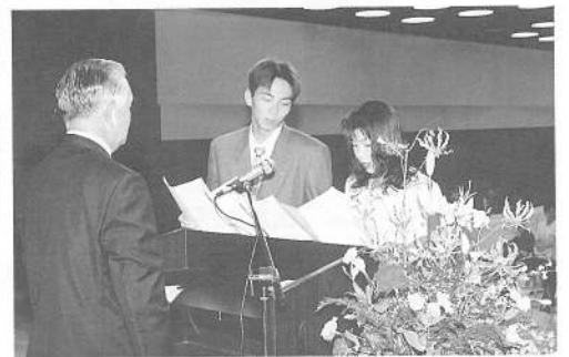
成人誓いのことば

一、私たちは憲法に保障された平等の権利のもとにその義務と責任を果します。 一、私たちは我々の協同体である郷土、国家、社会と民族及び人類の幸福と平和のため共に扶けあい力をつくします。 と誓いのことばを読みあげ、大人になった自覚を新たにしました。