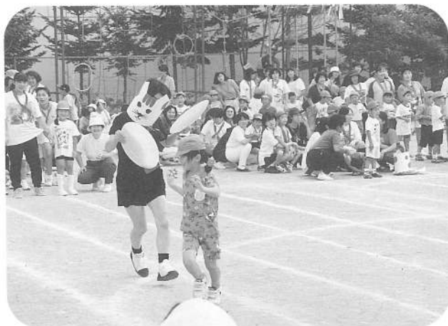
ニ ヤ ン ニ ヤ ン 競 走(年長)