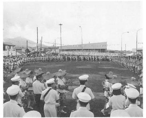
自衛隊の演奏に華をそえた、町内会婦人部、リハビリ女子職員の踊り（男性軍は自衛隊員）