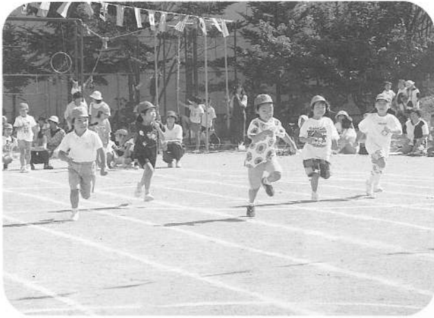
かけっこ(年長・年少)