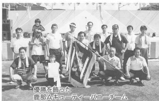
優勝を飾った 鹿部Aキューティーバーニークチーム