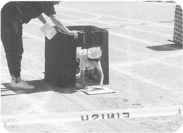
三匹の子ぶた(年少障害物)