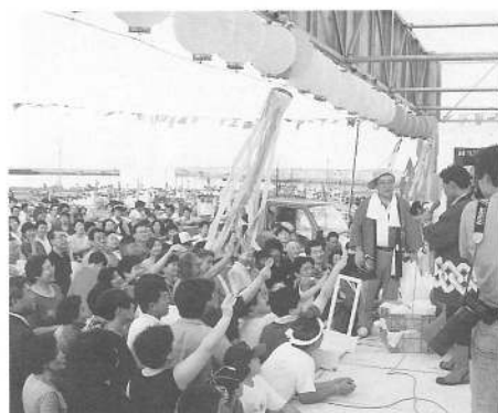
「活魚競り市」に群がる観客