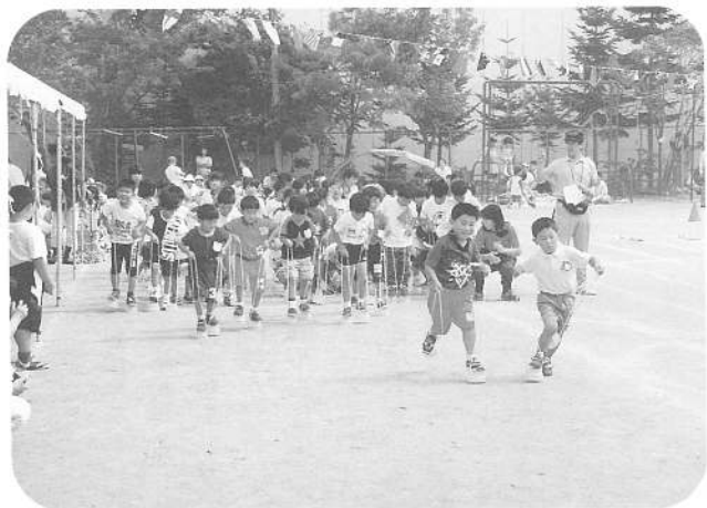
障 害 物 競 走(年長)