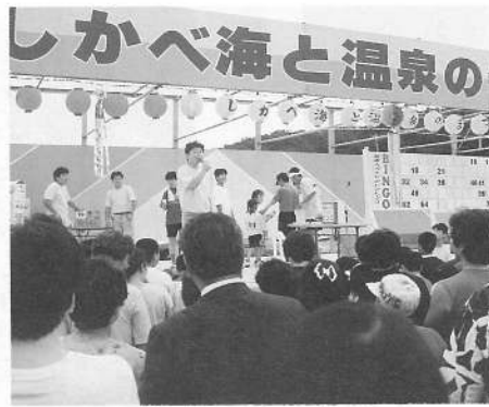
豪華景品でもりあがる 「ビンゴ抽選会」