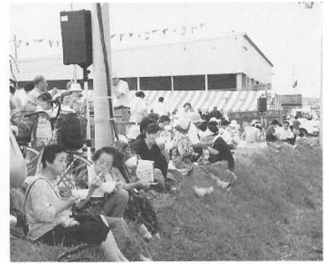
おかわりしたい「スリミ汁サービス」