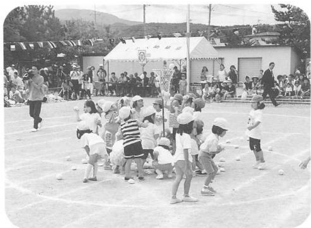
玉 入 れ(年少)