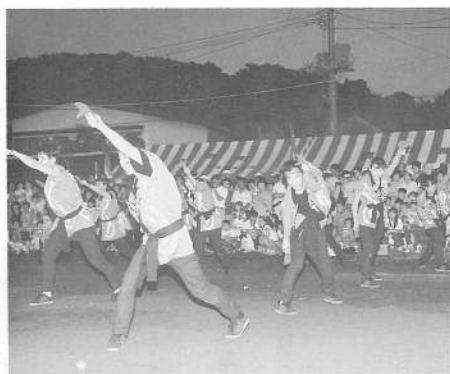
ニュー企画「よさこいソーラン踊り」なるこを手にしてのノリの良い踊りは、観客をもまきこんでのにぎわいとなりました