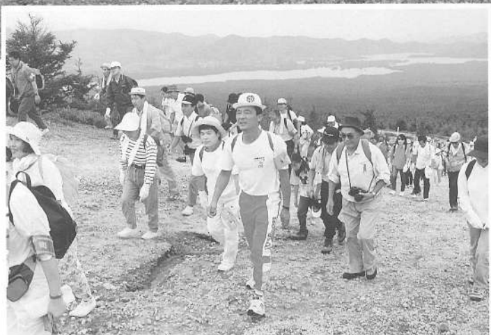
8/27 4町合同駒ヶ岳登山より