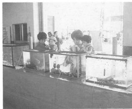
ほのぼのしたひととき 「ふれあい水族会」