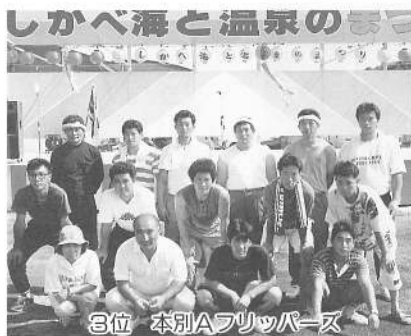
3位 本別Aフリッパーズ

カッター競技の結果(2回の合計タイム) 優勝—6分20秒 準優勝—6分32秒 3位—6分35秒 4位—6分50秒 ※優勝チームには、賞金10万円が贈呈されました。