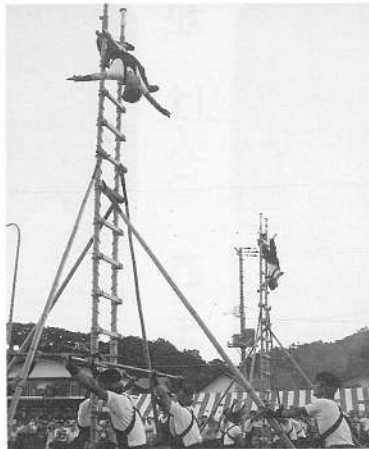
勇壮「はしご乗り演技披露」