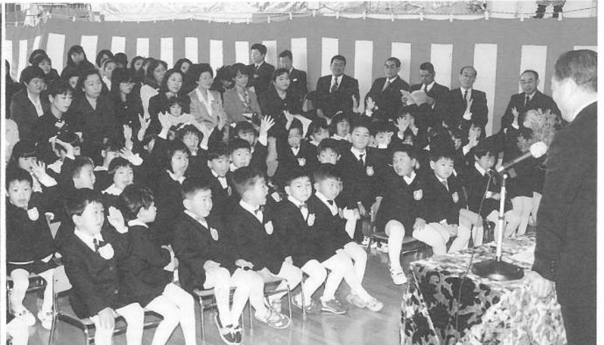
4/7しかべ幼稚園入園式