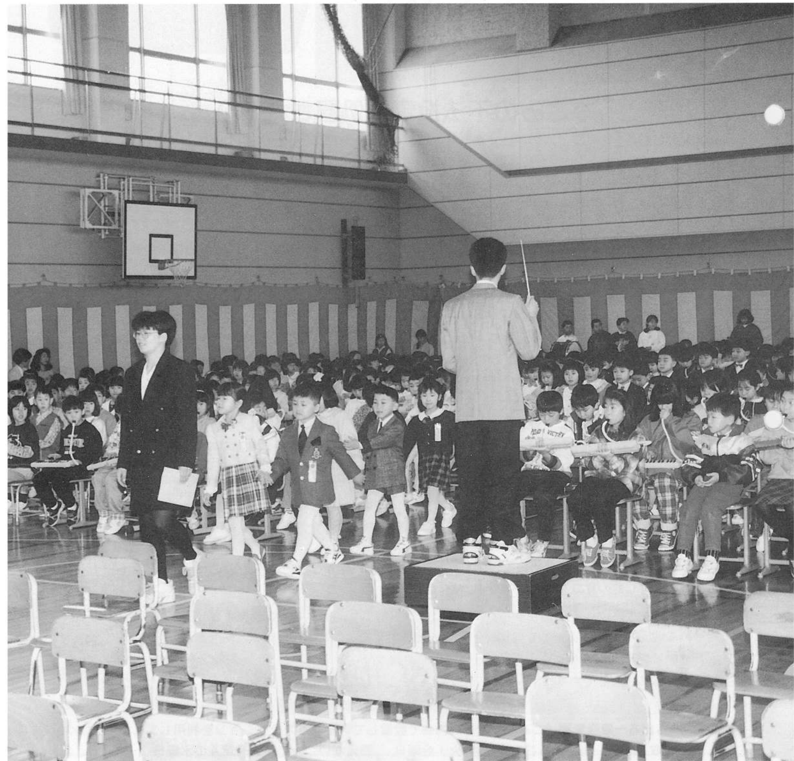
4/6 足ども軽く / 鹿部小学校入学式より