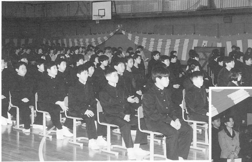
4/6鹿部中学校入学式