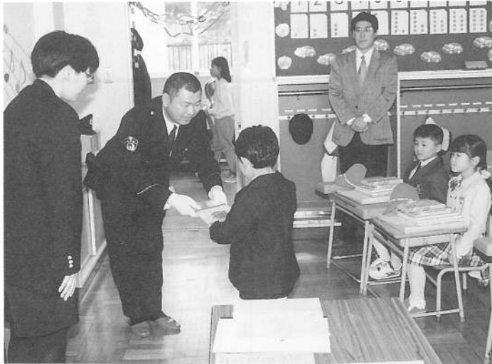
4/6鹿部小新入学児童へ鹿部ライオンズクラブからアルバム、森地区安全協会・森警察署からノートの寄贈がありました。