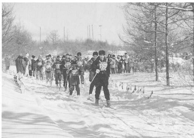
6kmコースをスタートする選手