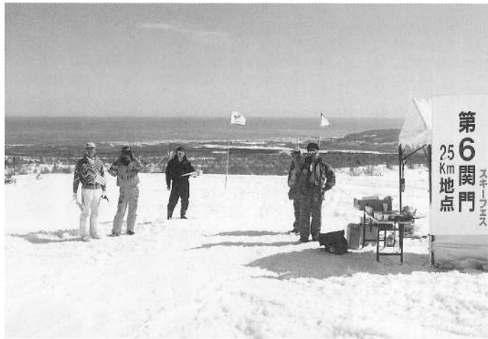
鹿部寄り第6関門地点