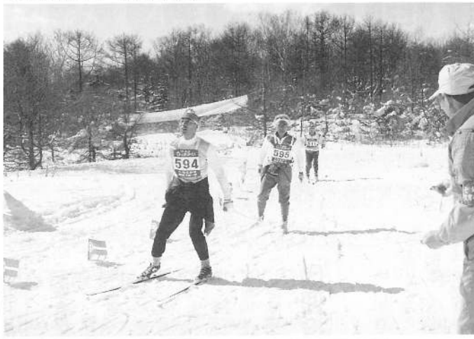
相次いでゴールする選手