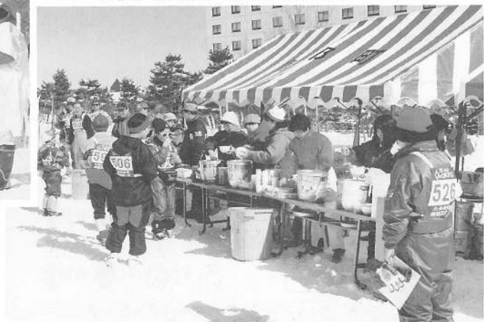
ゴール後、飲物などをいただく選手の皆さん