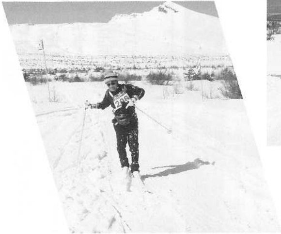
駒ヶ岳をバックに疾走