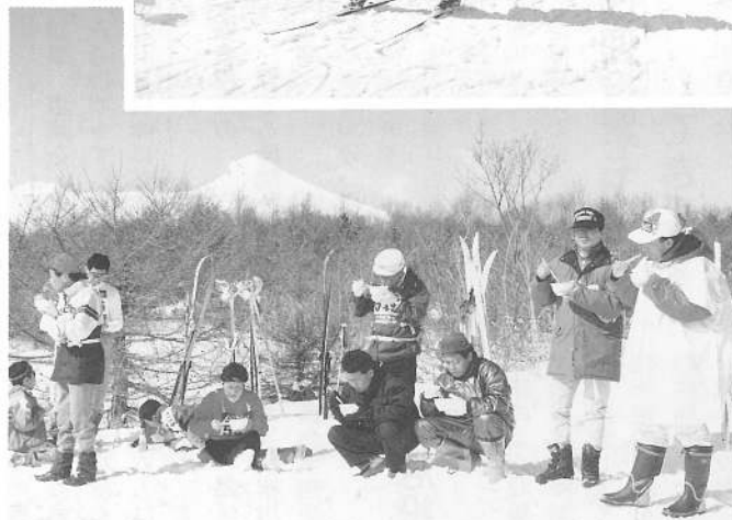
駒ヶ岳をバックに食べるブタ汁はおいしい！