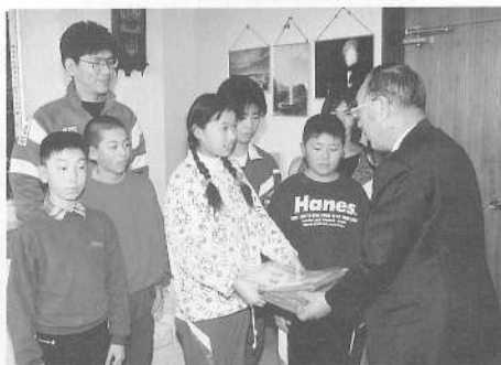
義援金を手渡す鹿部小児童会の皆さん